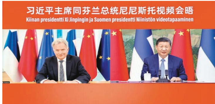
◆1月10日下午，國家主席習近平在北京同芬蘭總統尼尼斯托舉行視頻會晤。

香港文匯報訊 據新華社報道，1月10日下午，國家主席習近平同芬蘭總統尼尼斯托舉行視頻會晤。