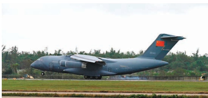
◆嫦娥六號任務探測器產品運抵文昌發射場。

據介紹，嫦娥六號的預選著陸區位於月球背面南極-艾特肯盆地。區別於人類此前曾進行的月球正面取樣，嫦娥六號此次取樣的月球背面更為古老，更具有科研價值。在嫦娥六號任務中，科學家們計劃對月球背面樣品進行系統、長期的研究，分析月壤的結構、物理特性、物質組成，爭取獲