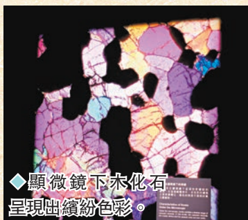
◆顯微鏡下木化石呈現出繽紛色彩。