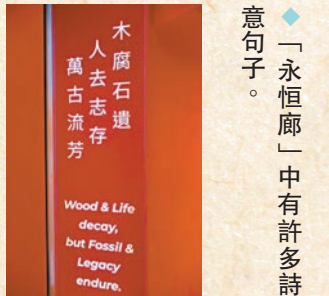
◆「永恒廊」中有許多詩意句子。