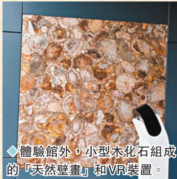
◆體驗館外，小型木化石組成的「天然壁畫」和VR裝置。

位於如心園內的木化石體驗館，高兩層，設有十六個主題展區及一個活動室，介紹世界各地的木化石收藏，培養大眾對木化石和地質學的興趣。