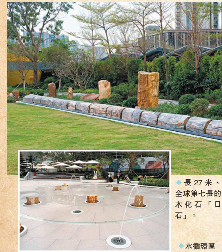
◆長27米、全球第七長的木化石「日石」。