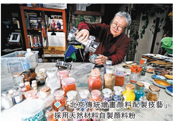
◆「北京傳統繪畫顏料配製技藝」採用天然材料自製顏料粉。