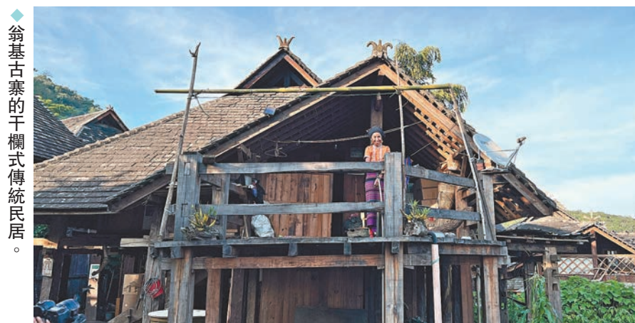
◆翁基古寨的干欄式傳統民居。