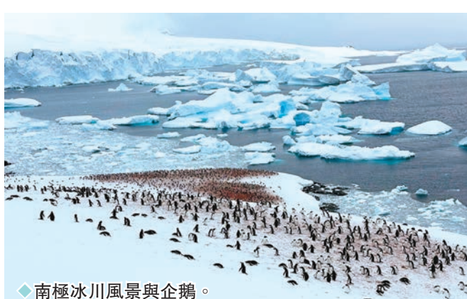
◆南極冰川風景與企鵝。