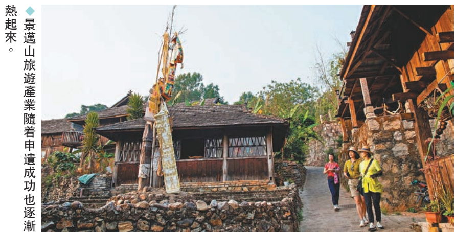
◆景邁山旅遊產業隨着申遺成功也逐漸熱起來。

位於景邁大寨，是景邁山的核心宗教場所之一，現有一新一舊廟宇建築兩座。部分建築雖舊，但風格保存完好；雕花窗格、漆畫板壁都在。