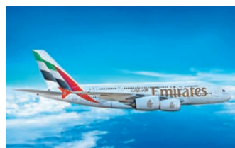
◆阿聯酋航空推出限時票價優惠。

此外，阿聯酋航空近日擴展於香港的服務，由即日起額外增設每日一班往返杜拜與香港的直航航班，加強香港與其環球客運網絡的連接。新設航班採用波音777-300ER客機，配合現有兩班採用阿聯酋航空的旗艦A380客機航班。現時，阿聯酋航空每日營運兩班直飛杜拜的航班，以及每日一班香港經曼谷往返杜拜的航班，旅客可應旅遊計劃，自行選擇合適的航班。 ◆文：雨文