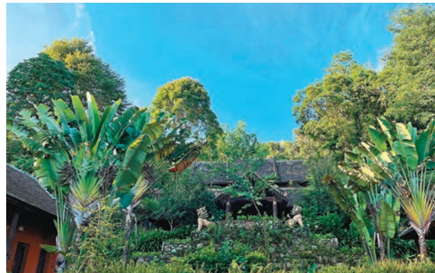
◆「景邁山古茶林文化景觀」入列《世界遺產名錄》。