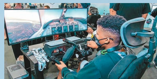
◆VR技術有助提升飛行培訓效率。圖為FlightSim Expo中一款飛行模擬器。網上圖片設有6個全動態飛行模擬器，幫助學生在實際飛行前熟悉飛機駕駛環境。學院也利用專業的培訓軟件和AI技術，綜合分析每名學員的表現，旨在做到因材施教。