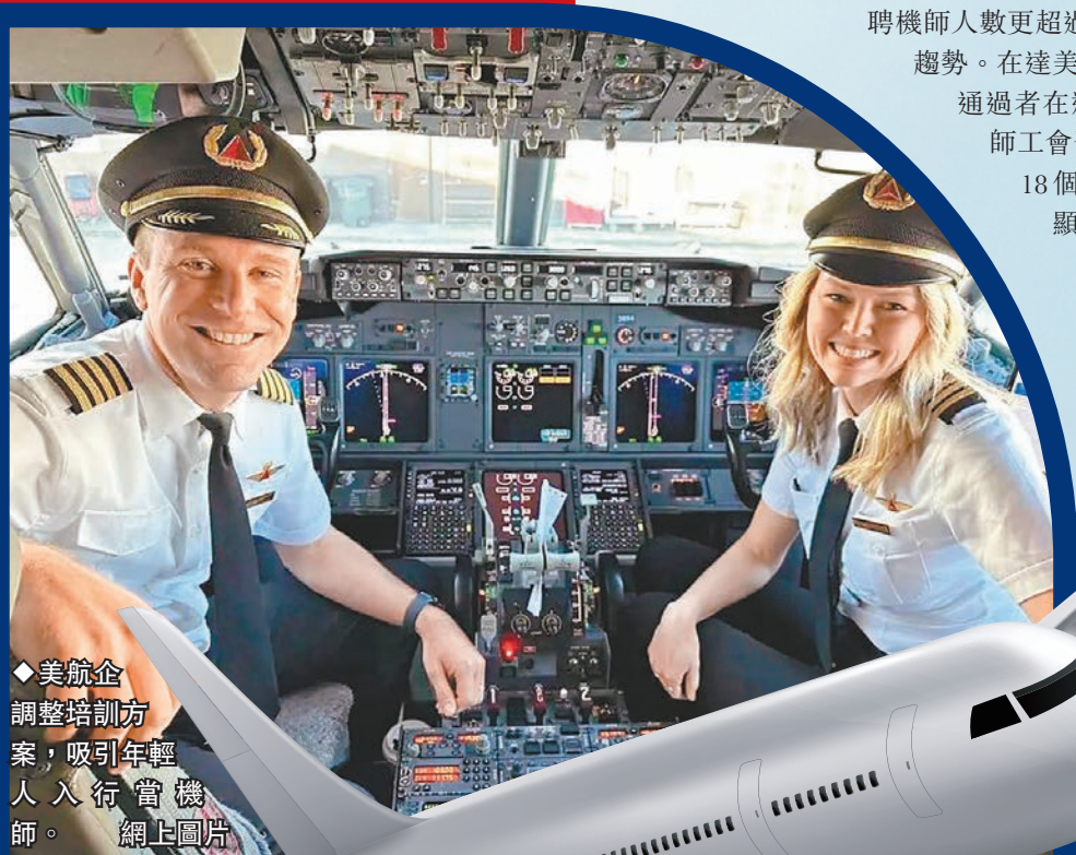
◆美航企調整培訓方案，吸引年輕人入行當機師。

香港文匯報訊 隨着全球旅遊業迅速復甦，各地不少航企都面臨「機師荒」。航企的機組人員編排中，既需要經驗與質素俱佳的機長，也需要能力扎實且進步迅速的機師。《華爾街日報》指出，美國多間航企在疫情後加緊招聘，尋找一些有一定飛行經驗的機師，同時透過調整培訓方案、合理化機組搭配等方式，加快合資格機師晉升機長的進度，希望此舉更好整合航企內部資源，協助恢復運力，滿足遊客出行需求。