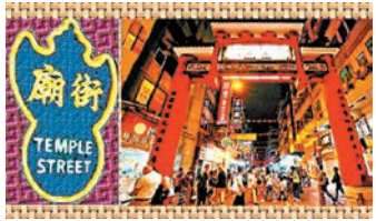
美食當前，夜遊人為祭五臟廟而來乎。

人，有賣髮乳的，開檔後一直不斷以他出售的髮乳在梳理他那把長髮，大光燈照射着他那滿頭油光照人的黑髮，全廟街過路人盡為之側目。 也有自稱打蠟佬的，說他擺賣的東西是同人家打蠟無須成本偷來的，開這麼大的玩笑不怕犯法，膽子可不小。世伯說，上世紀六十年代物價平，當時成衣不像今日可以到處買得到，擺檔裁縫為人度身，連工包料普通一件質地不錯的男裝長袖恤衫也不過15元；他在五金攤檔買的一把不到4吋木柄九用刀至今仍閃亮如初。 世伯說少年逛廟街，當時10塊錢很好用了，有次半途給人從後拍膊索取10塊錢，他一時心急智生低聲對那人說：「你睇唔到後面個便衣嗎？」嚇得那人即時就從人叢中拔足而逃，怪不得有人說舊日廟街也是龍蛇混雜之地，不過街頭街尾燈火明暗那種神秘刺激感覺，也迷倒過不少年輕人，今日不是那種情調了。