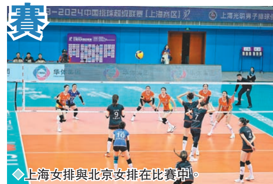
◆上海女排與北京女排在比賽中。