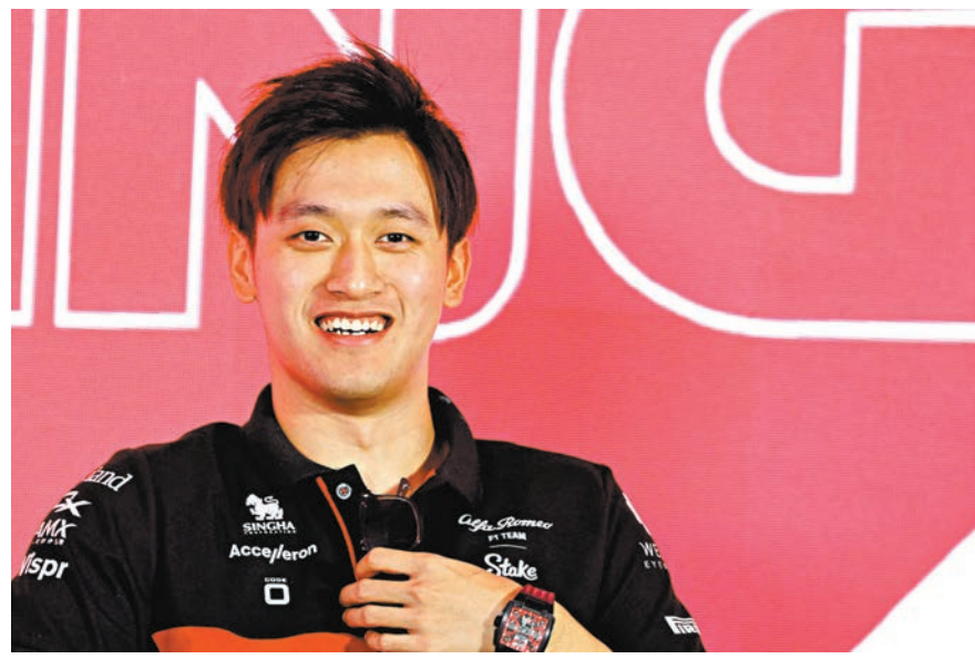
◆周冠宇對新賽季充滿期望。