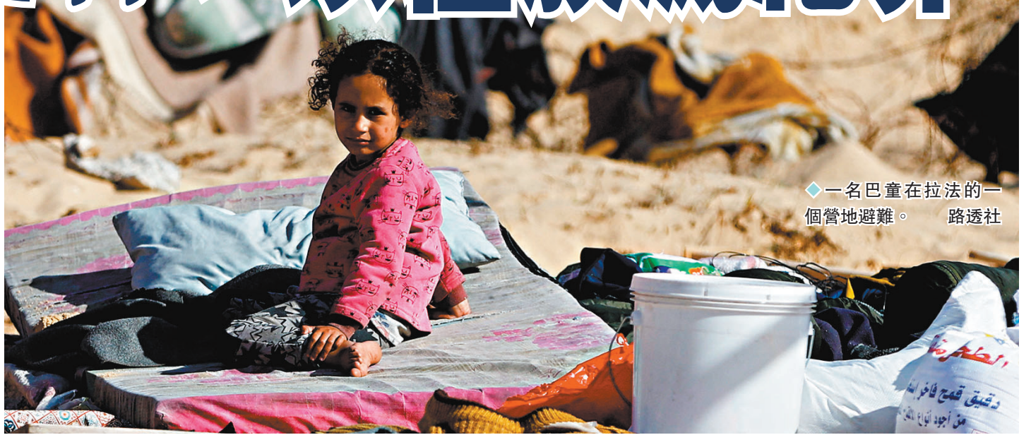
一名巴童在拉法的一個營地避難。

新一輪巴以衝突已造成加沙地帶逾2.3萬巴人平民死亡，其中70%據信為婦孺，流離失所的巴人達190萬，佔當地人口約85%。《衛報》分析稱，對於國際法院可能頒布的臨時禁令或最終裁決，以色列可以故意不執行，但這一做法勢必嚴重損害以色列和美國的國際聲譽。