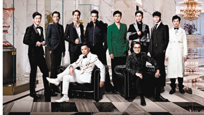
「最佳男配角」競爭同樣激烈。