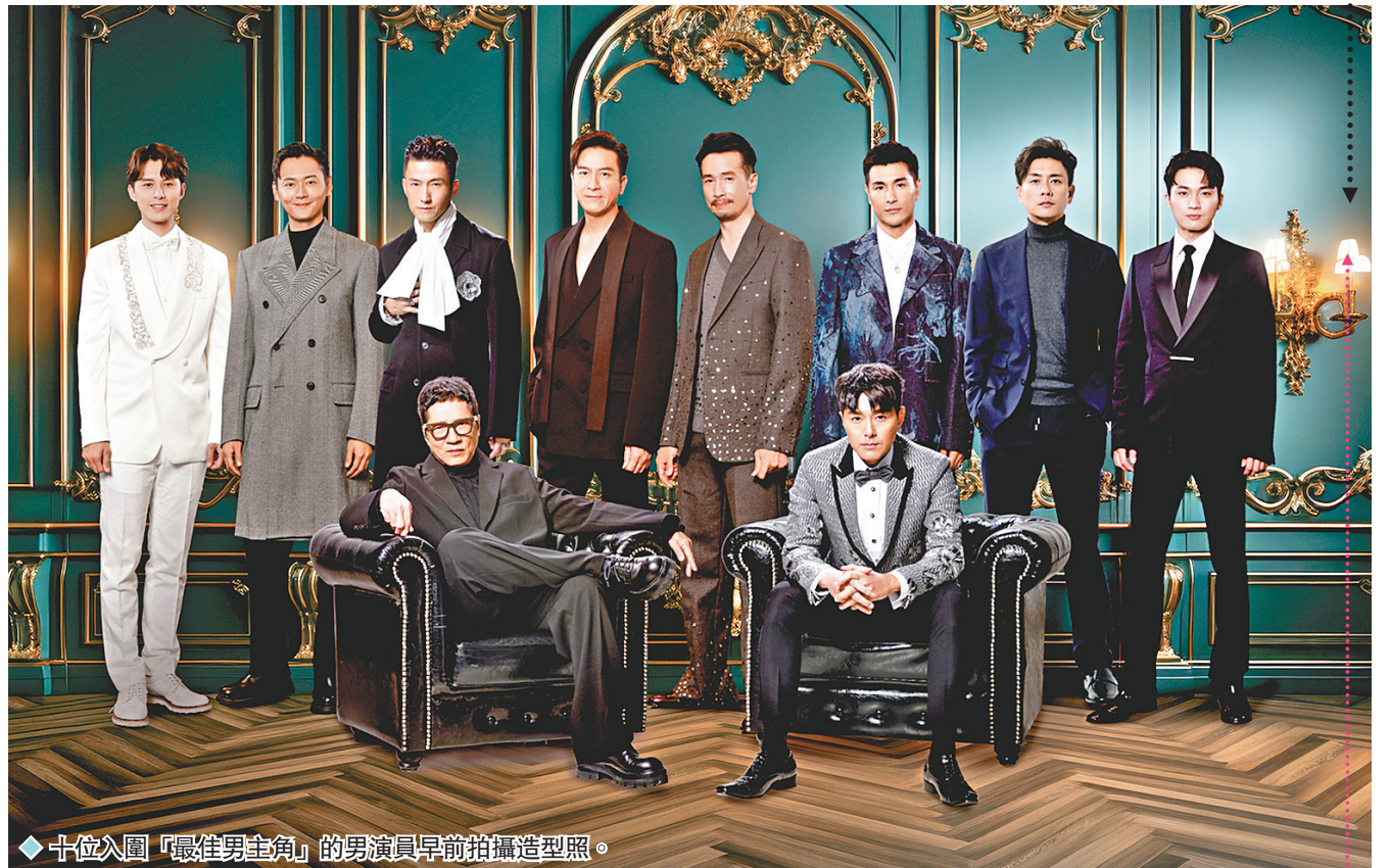
十位入圍「最佳男主角」的男演員早前拍攝造型照。