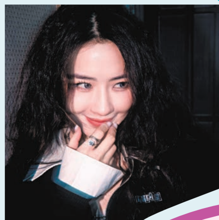
菊梓喬發文疑似宣布離巢，自言百感交集。