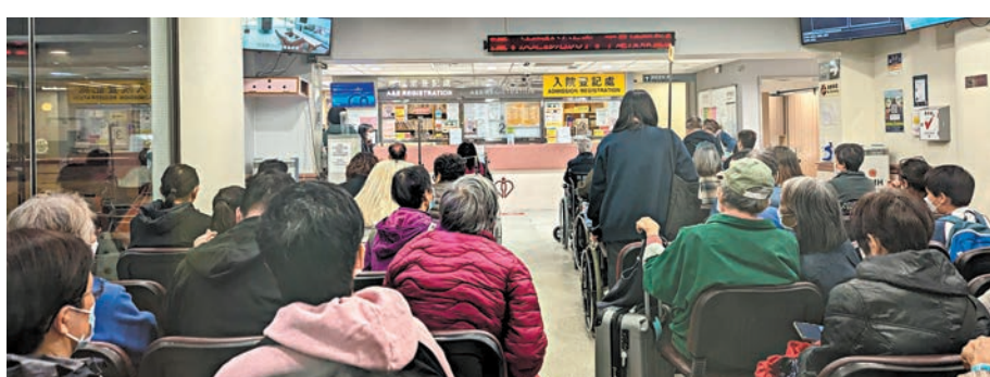
▲流感高峰下，急症室求診人數急升。