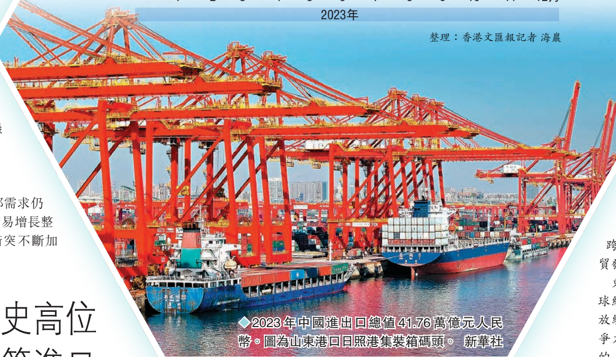
2023年中國進出口總值41.76萬億元人民幣。圖為山東港口日照港集裝箱碼頭。