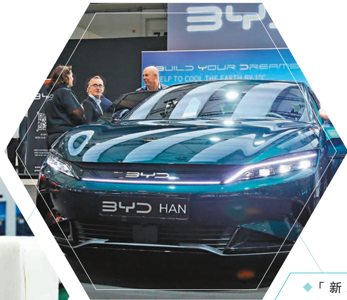
「新三樣」產品包括電動載人汽車、鋰離子蓄電池和太陽能電池。資料圖片

下一步，海關將支持關鍵零部件和重要原材料等進口，保障糧食、能源資源、優質農產品穩定供給，完善高效順暢的通關機制，為拓展中間品貿易創造更好的口岸營商環境、更便利的跨境貿易服務。