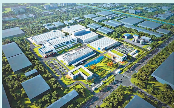
上海莫德納醫藥研發生產基地效果圖。