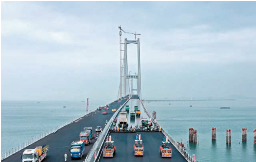
◆深中通道全部鋼橋面鋪裝完成。圖為鋼橋面鋪裝現場。

項工程建設已進入通車衝刺期，橋樑護欄、伸縮縫的安裝施工同步推進，春節期間各項工程將持續保持進度「不減速」。今年春節後項目將開始海底隧道內混凝土瀝青路面施工。