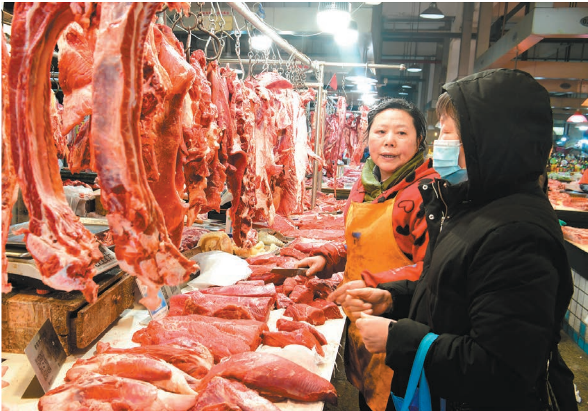
◆國家統計局數據顯示，食品價格仍是拖累CPI下降的主要因素。去年12月，食品價格同比下降3.7%，其中，豬肉價格下降26.1%。圖為1月12日，市民在江蘇省太倉市城廂鎮中心菜場購買肉製品。

香港文匯報訊（記者 海巖 北京報道）國家統計局12日發布數據顯示，受寒潮影響農產品運輸疊加節前消費需求增加等因素影響，2023年12月內地居民消費價格指數（CPI）同比下降0.3%，降幅比前月收窄0.2個百分點，但已連續三個月負增長；豬肉價格同比下降26.1%，是CPI同比下降的主要因素，不過，扣除食品和能源價格的核心CPI連續三月穩定在0.6%。專家普遍預計，2024年內地物價水平將溫和回升。