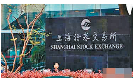
◆中證監表示，下一步將科學合理保持IPO常態化，並提高上市公司質量。資料圖片

論及市場關注的中長期資金入市問題，證監會機構副司長林曉征稱，截至去年底，社保基金、公募基金、保險資金、年金基金等各類專業機構投資者合計持有A股流通市值15.9萬億元(人民幣，下同)，較2019年初增逾1倍，