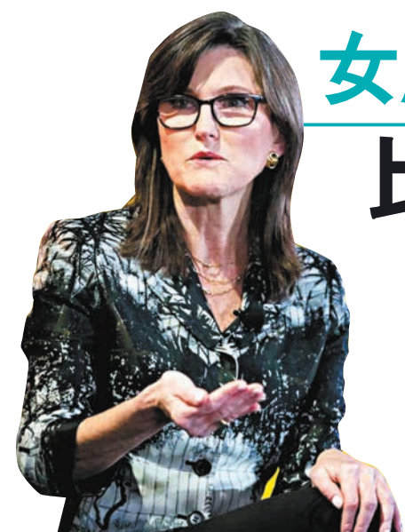
◆方舟投資創辦人Cathie Wood認為，即使是在悲觀情況下，比特幣也會上升至25.85萬美元。資料圖片

(ARK Invest) 創辦人、有美國「女股神」之稱的Cathie Wood繼續唱好，更預期2030年最牛看150萬美元。