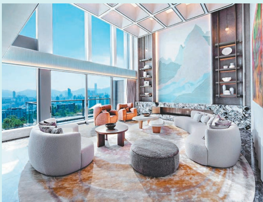
◆緹外昨透過招標以6.19億元售出第1座6樓及7樓B室頂層逾8,500平方呎複式大宅，為緹外首宗頂層特色大宅成交，成交價更創下九龍分層戶新高。

近期豪宅新盤成交轉旺，昨天更連錄兩宗逾6億元成交。嘉里建設旗下九龍半山緹外昨透過招標以6.19億元售出第1座6樓及7樓B室頂層逾8,500平方呎複式大宅，此成交除了為緹外首宗頂層特色大宅成交及2024年之第二宗成交外，其成交價更創下九龍分層戶新高。 ◆香港文匯報記者 梁悅琴