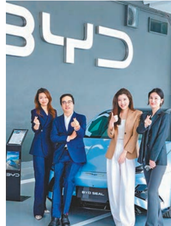
◆和諧汽車香港比亞迪服務中心為車主提供全方位的卓越服務體驗。

放眼未來，和諧汽車在香港的比亞迪售後服務體系將繼續擴展。除了油塘服務中心外，和諧汽車正計劃於荃灣開設全新比亞迪4S服務中心，以滿足九龍西、新界西和港島西區的比亞迪車主需求。同時，和諧汽車亦計劃在沙田大圍開設比亞迪服務中心，服務九龍中部、新界北部和港島中部的車主。隨着和諧汽車在香港的比亞迪售後服務體系的逐步完善，未來和諧汽車的售後服務將覆蓋全港，滿足更多比亞迪客戶需求。