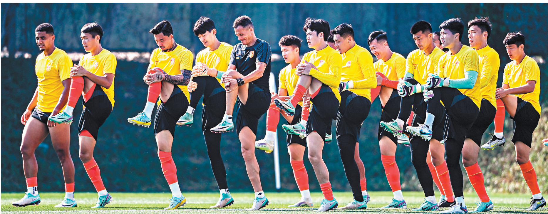
國足在多哈備戰亞洲盃。