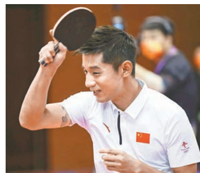
◆奧運冠軍張繼科擔任一家乒乓球俱樂部技術顧問。