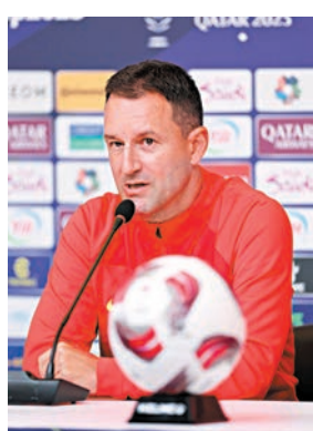
◆國足主帥揚科維奇出席賽前發布會。

帥揚科維奇的訓練效果更一度受到質疑。不過揚科維奇表示，目前球隊的體能儲備已達到亞洲盃比賽要求。「我們剛開始時的訓練強度大了一些，在热身賽中我們身體會有些發沉。但我這樣安排是有目的的。我們需要為亞洲盃和世外賽所面臨的嚴峻考驗注入『燃料』。因此，我多少也把這些热身賽的成績放在了次要位置。在備戰的前十天，我們的負荷一直很重。但現在我們的狀態越來越好，雙腿越來越輕盈。」