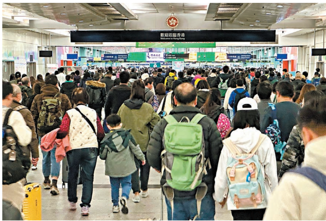
◆香港文匯報記者 文森 ◆上月訪港旅客增加至近400萬人次。

香港旅遊發展局昨日公布，去年全年訪港旅客有近3,400萬人次，恢復至疫前約五成半，其中上月訪港旅客增加至近400萬人次。內地旅客佔整體訪港旅客的79%，過夜旅客佔整體訪港旅客的一半，比例較疫情前高。旅發局總幹事程鼎一指有關數字理想，局方新一年繼續針對不同客源市場進行宣傳，並透過舉辦盛事推動香港旅遊業穩健復甦。旅遊促進會總幹事崔定邦則持份者致力改善服務質素，並恒常性舉辦盛事發展高增值旅遊。