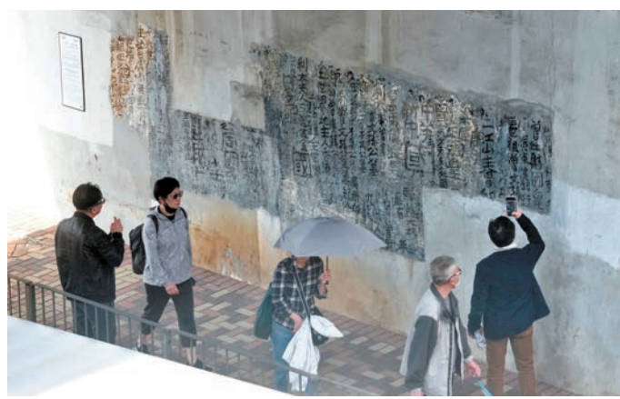
◆「九龍皇帝」曾灶財「墨寶」經修復後重見天日。

劉家鴻表示，當時也曾想過在牆外用大型塑膠板或膠片進行保護，但蓋板與牆面間難免會有縫隙，下雨後難以清理，塑膠板本身會老化，不易保養，最後決定直接塗上一層保護漆以防水防紫外線，同時最大限度還原墨跡當年面貌，「本來就是街頭藝術，以街頭的方式呈現應該是最好。」他指路過的行人可近距離觀賞，甚至用手觸摸，但不希望有人劃損破壞。