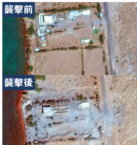
襲擊前 襲擊後 衛星圖片顯示胡塞武裝據點在美英擊後設施盡毀。法新社

也門和伊朗周五均有民眾大規模遊行抗議美軍及其盟友空襲。法新社報道,數十萬人周五晚聚集在薩那市中心,多人揮舞也門和巴勒斯坦旗幟,高呼「美國去死、以色列去死」等口號。伊朗首都德黑蘭亦有數百人示威,有民眾在英國駐伊朗大使館外焚燒美國、英國和以色列國旗,聲援也門和加沙地帶巴人。