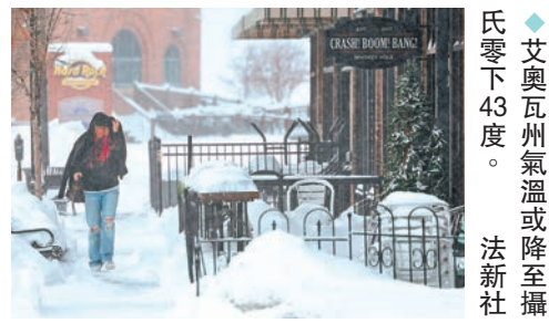
◆艾奧瓦州氣溫或降至攝氏零下43度。

中部各州連續斷電、斷水、供暖中斷數日,影響數百萬居民。2022年的冬季風暴導致美東多地電力和天然氣系統受損。據統計今次冬季風暴,可能讓美國錄得自前年12月以來最寒冷的均溫。