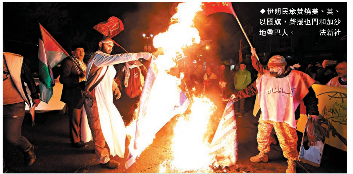
◆伊朗民眾焚燒美、英、以國旗,聲援也門和加沙地帶巴人。