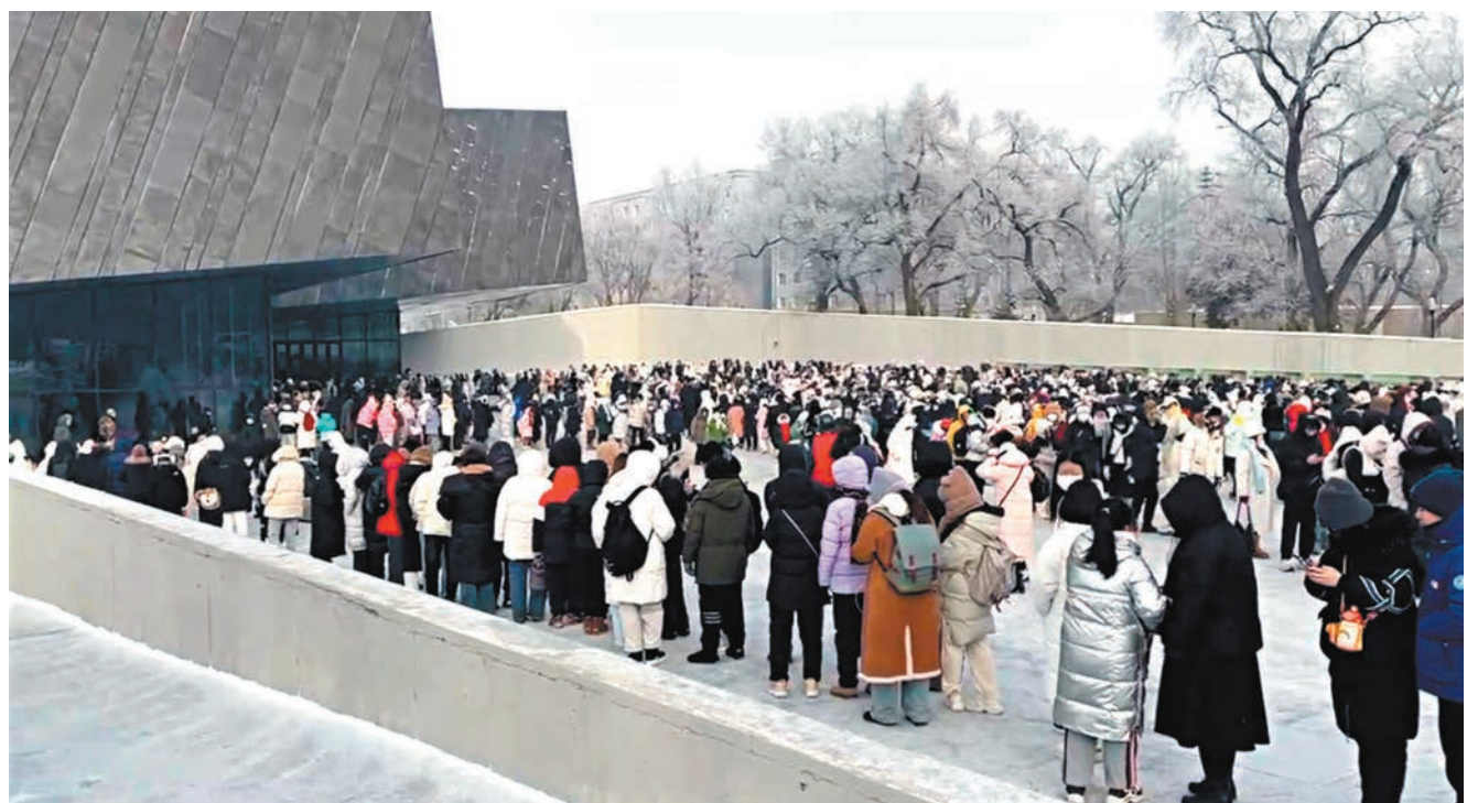
◆哈爾濱侵華日軍七三一部隊罪證陳列館外排起長龍。

按照陳列館安全管理相關要求，為保證廣大觀眾良好的參觀體驗和安全有序的參觀環境，七三一部隊罪證陳列館發出公告，自2024年1月14日起實行預約制，限定每日最大接待量為1.2萬人。同時陳列館放棄閉館休息日，實行一周七天連續接待遊客。更緊急招募有志於紅色文化傳播的志願者，為參觀遊客提供引導服務。