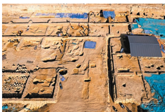
◆2023年3月8日，俯瞰河南鄭州商都遺址書院街墓地考古發掘現場。

「中」字形、「甲」字形的大墓，為商王級的大墓，書院街墓地是商代中期早段，安陽殷墟王陵屬於晚商時期。以此來看，書院街墓地比殷墟王陵早了近200年，在禮制方面是商文化從早商、中商到晚商文化的傳承，如陪葬品風俗、祭祀習慣等一脈相承。從文化線索來看，商文化傳承關係明確，書院街墓地是殷墟西北崗王陵東西方形兆域的源頭。