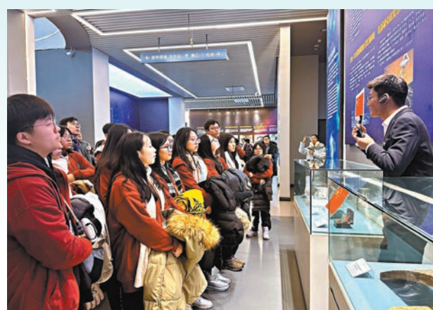
◆港青參觀哈爾濱工業大學航天館。

香港文匯報訊（記者 王欣欣、于海江 哈爾濱報道）「五四三二一，發射！」不久前，廣西「小砂糖橘」的哈爾濱研學之旅在全網各個平台被上千萬網友關注圍觀。在有着「航天第一校」美譽的哈爾濱工業大學，校方不僅為「小砂糖橘」安排了模型火箭發射環節，還展示了長征一號運載火箭、東風二號導彈等真傢伙，羨煞全體網友。帶隊梁老師感動地說：「天