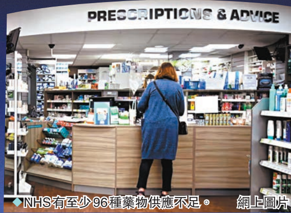
◆NHS有至少96種藥物供應不足。網上圖片

針對英格蘭藥房一項調查顯示，87%藥房員工都稱病人健康因藥物供應短缺受到威脅，政府和NHS必須介入解決。