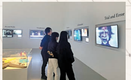
◆展覽現場以視頻的方式展現了幕後的創作故事。