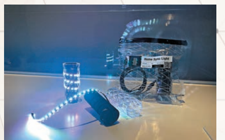
◆展覽特設展廳展示幕後的創作故事及儀器設備等。圖為Rhizomatiks開發的家用聲光同步燈。