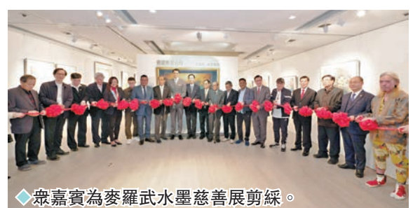
◆眾嘉賓為麥羅武水墨慈善展剪綵。