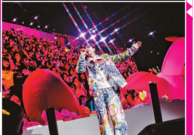
軒仔為歌迷獻唱《隔夜茶》等甚少唱的歌曲。