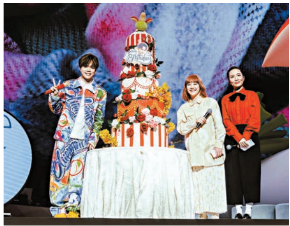
軒仔的多層生日蛋糕甚是繽紛。

其間，軒仔亦有自己一些內心的分享，他直言從小到大都不喜歡過生日，主要是不想給反應，但今年很特別，歌迷會於疫情期間成立，他覺得這幾年都沒太多機會跟大家見面，「雖然今次話係免費入場，但我知道大家都好舟車勞頓，好破費，我成日諗呢啲就係我嗰個世上享受緊嘅福氣，所以想藉住呢個birthday party見吓大家、多謝大家。」他直言希望將生日會變成一個更有意義的聚會：「入咗行咁多年我從來冇因為擇唔到獎而唔開心，或者因為對方擇到獎而妒忌。由細到大我覺得我阿媽教得我最舒服嗰樣嘢就係我好識得去替人哋開心。所以大家不妨改變你嘅信念，試吓改變你對呢啲事情嘅反應，試吓開始將『共贏』呢兩個字放入你嘅社交圈入面，好多事都做到嘍。」