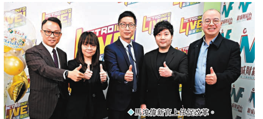
馬浚偉新官上任促改革。