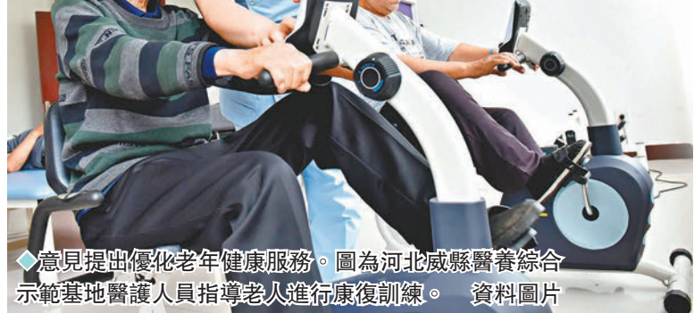
意見提出優化老年健康服務。圖為河北威縣醫養綜合示範基地醫護人員指導老人進行康復訓練。

相關文件的發布令來自香港的大灣區醫療集團聯席行政總裁李家聰博士倍感振奮。過去幾年，他帶領團隊將港式醫療服務模式拓至大灣區內地城市，設立了包括港澳居民健康服務中心在內的160多間港式家庭醫生工作室。兩個