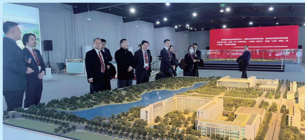
考察團了解北京市城市中心規劃發展。

境，並聯動粵港澳大灣區，進一步吸引外資及海外遊客。考察團成員亦指出，香港與北京城市副中心有龐大合作發展潛力，包括加強在創新科技領域合作、建立數據中心等；北京更擁有世界級的文化藝術設施，京港雙方可探討在文創領域加強聯繫，共促中外藝術文化交流。