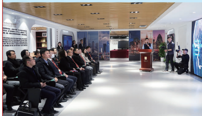
考察團參觀朝陽區人民政府招商投資服務中心。