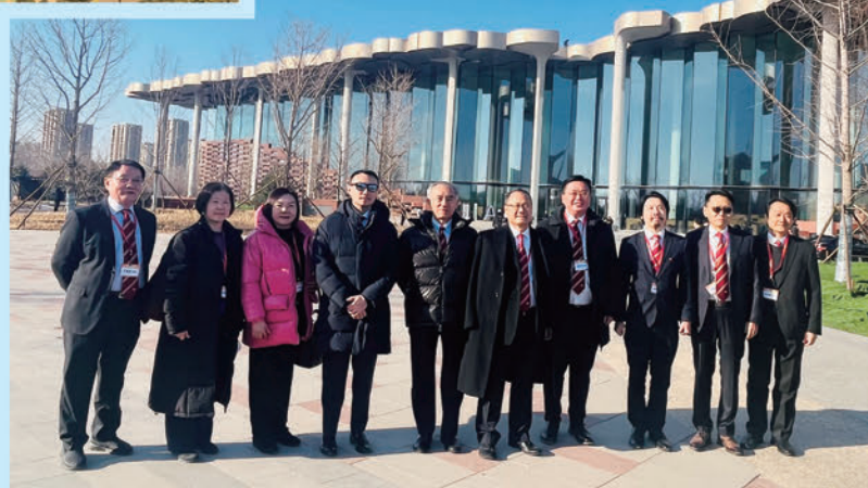
考察團於城市綠心建築前留影。