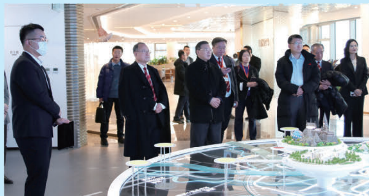
考察團參觀運河商務區新光大中心。