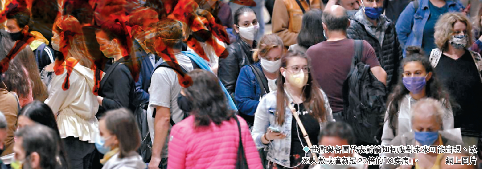
◆ 世衛與各國代表討論如何應對未來可能出現、致死人數或達新冠20倍的「X疾病」。

香港文匯報訊 正在瑞士舉行的達沃斯世界經濟論壇，將於周三（1月17日）舉辦「為「X疾病」(X Disease)作準備」會議。世界衛生組織總幹事譚德塞領導的專家小組，將與多名各國高官參會。據彭博通訊社報道，各代表將討論如何應對未來可能出現、致死人數可能達感染新冠疫癘人數20倍的X疾病，加緊完善醫療體系，並合作加強對潛在高危害病原體的追蹤和研究。