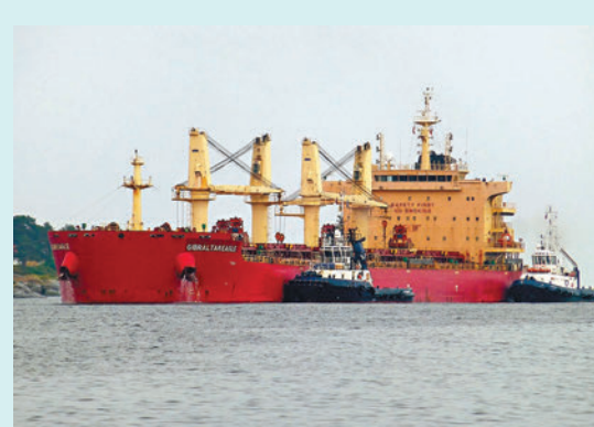
◆ 美國公司擁有和營運的「直布羅陀鷹」號貨櫃船被胡塞武裝發射導彈擊中。資料圖片

領事館附近周二發生多宗爆炸，伊朗革命衛隊對埃爾比勒發動的「連串襲擊」已造成至少4人死亡及5人受傷，死傷者包括當地平民。