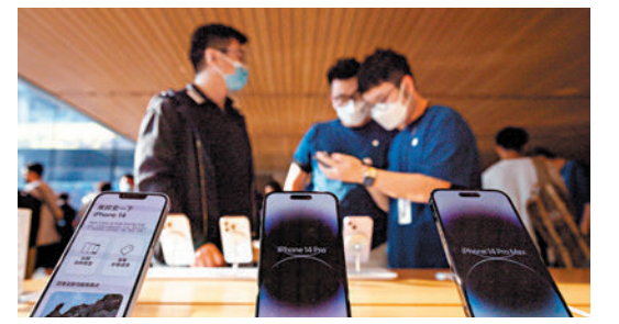
◆ iPhone今年首周在中國市場的銷量出現斷崖式下跌。

價。蘋果的可穿戴產品包括智能手錶和耳機等上季收入約93億美元（約727.6億港元），佔整體收入約一成。