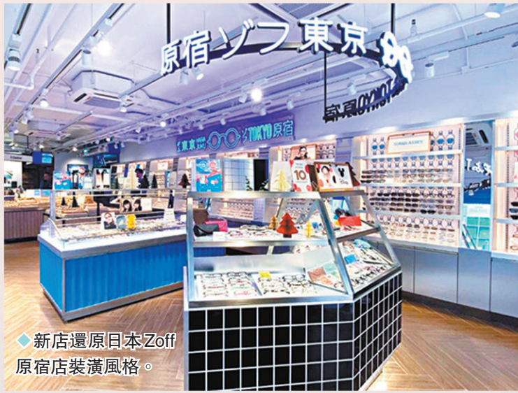
◆新店還原日本Zoff原宿店裝潢風格。