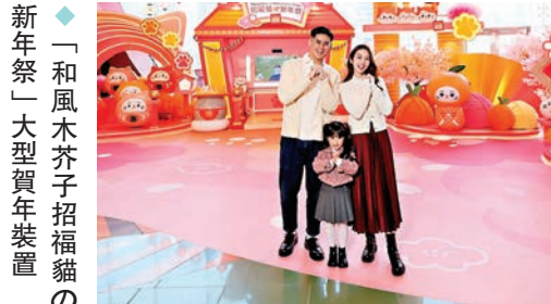
◆「和風木芥子招福貓」新年祭大型賀年裝置