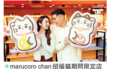
◆marucoro chan招福貓期間限定店