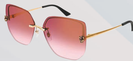
◆卡地亞秋冬眼鏡系列

卡地亞經典眼鏡玩味雋永與創新之間的微妙界線，持續推陳出新，精心打造嶄新系列，融合穿越時空的優雅風格和前所未見的精緻工藝，精雕細琢造就當代時尚。例如，Panthère de Cartier美洲豹系列仿效同名系列的珠寶作品，以非凡的精準度呈現每個刻面和細節，重新詮釋美洲豹動人矚目的姿態，包括鼻托和鏡片的幾何輪廓，以及璀璨閃耀的立體裝飾。