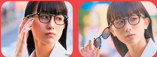
◆OWNDAYS x HUAWEI Eyewear 2 ◆搭配SNAP前掛鏡片，一秒即可更換為太陽眼鏡。

早前，日本東京眼鏡品牌OWNDAYS與華為科技日本有限公司（華為日本）推出全新「OWNDAYS x HUAWEI Eyewear 2」，有四種款式可供選擇，讓你體驗更舒適的配戴感，與更優質的聽覺體驗。這副OWNDAYS x HUAWEI Eyewear 2另可搭配品牌獨有的SNAP LENS，正面為磁吸式設計，你只需輕輕放上