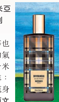
◆波希米亞之花系列

花卉絕對是調香師的終極繆斯，是他們的女主角，在無盡的變化中實現他們異想天開的夢想。花瓣錯綜複雜的結構、花冠玲瓏的曲線、色彩漸變的發揮和雌蕊堅強的姿態，展現出它獨特的美麗。MemoParis便將整個系列獻給花卉，猶如風捲起了四周的花粉。毫無疑問，是