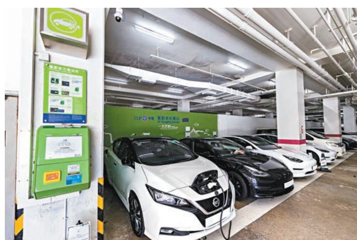
去年約有三分之二的落地新車都是電動車。

在法例實施首半年，特區政府將帶頭向公屋、三無大廈及鄉郊居民三類居民免費派發膠袋，每戶每月將獲發20個膠袋，「之所以不派足30個，是希望居民在適應法案的同時，也能夠形成回收意識，減少垃圾棄置量，也節省膠袋。」徐浩光說。