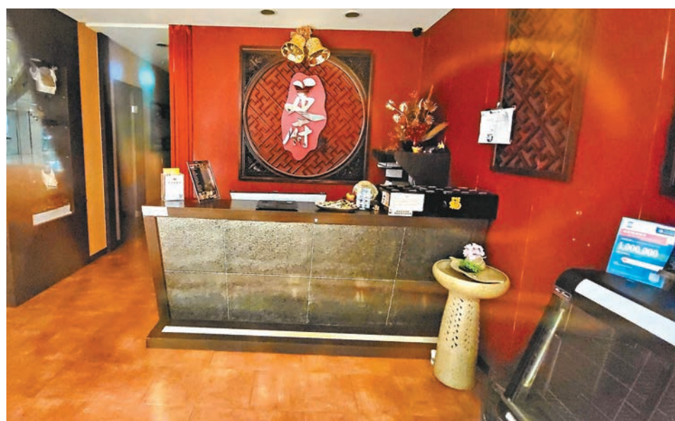
◆連鎖按摩店「足府」本月初全線結業。圖為大角咀分店。

海關回覆稱已接獲相關舉報，現正作出跟進，如發現違反《商品說明條例》（《條例》）的情況，會採取適當的執法行動。另提醒商戶必須遵守《條例》的規定，以及市民在購買預售形式售賣的服務時，應留意預繳式消費存在一定的兌現風險，一旦遇上商戶結業或者其他不能預計的情況，消費者有機會無法兌現已購買的服務。