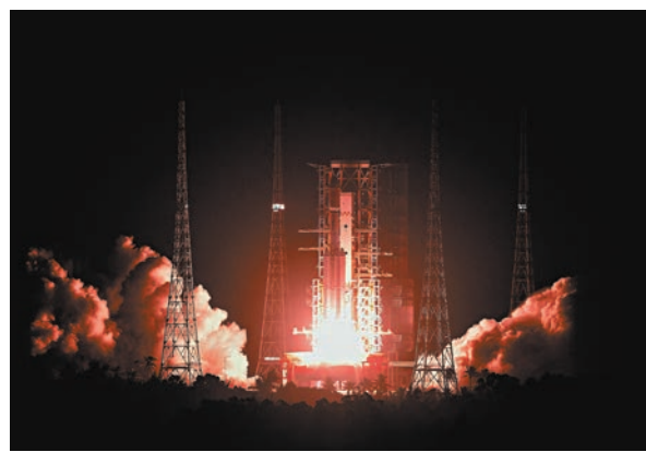
◆1月17日，搭載天舟七號貨運飛船的長征七號遙八運載火箭，在中國文昌航天發射場點火發射。

香港文匯報訊（記者 劉凝哲 北京報導）2024年中國太空站迎來開門紅，天舟七號貨運飛船發射成功。1月17日22時27分，搭載天舟七號貨運飛船的長征七號遙八運載火箭，在中國文昌航天發射場點火發射，約10分鐘後，天舟七號貨運飛船與火箭成功分離並進入預定軌道，之後飛船太陽能帆板順利展開，發射取得圓滿成功。後續，天舟七號貨運飛船將首次採用3小時快速交會對接方案，與在軌運行的太空站組合體進行交會對接。與此前的2小時和6.5小時快速交會對接方案相比，3小時方案不僅為太空站運輸物資提供更高效率的方式，並且減輕了各系統在執行任務過程中的壓力。