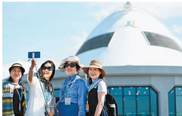
◆作為連接粵港澳三地的超級工程，港珠澳大橋已成為來珠旅遊的熱門打卡地。圖為遊客在港珠澳大橋東人工島（藍海豚島）合影留念。

此外，天舟七號此次還兼具「生鮮快遞」的重任，運送近90公斤新鮮水果，供給神舟十七號、十八號共同享用。據介紹，科研人員為此專門改進水果的保存方式，延長水果的保鮮期，針對太空站的新鮮水果冷藏冰箱亦在研製中。