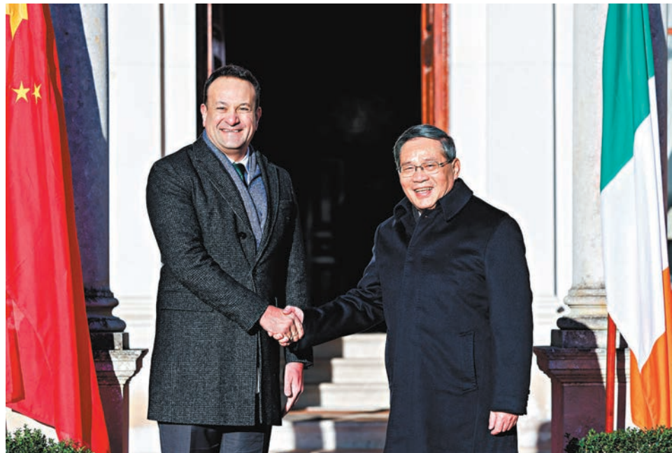
◆當地時間1月17日上午，國務院總理李強在都柏林國賓館同愛爾蘭總理瓦拉德卡舉行會談。

易、公平競爭、開放合作等市場經濟的基本準則。希望歐方在經貿問題上做到公正、合規、透明，公平對待中國企業，審慎出台限制性經貿政策和使用貿易救濟措施。雙方要以舉行中歐高級別人文交流對話機制新一輪會議為契機，加強教育、科技、文化、旅遊等領域對話合作，加速恢復人員往來，為中歐關係注入新活力。