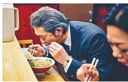
◆物價高漲下，不少日本打工仔均節省午餐費用。

日本去年共合多達逾3萬種食物漲價，民眾面對嚴峻的生活成本危機。由於進口牛肉價格飆升，大型連鎖食肆吉野家也決定7年來首次上調牛丼價格，但售價也只是468日圓（約25港幣）。