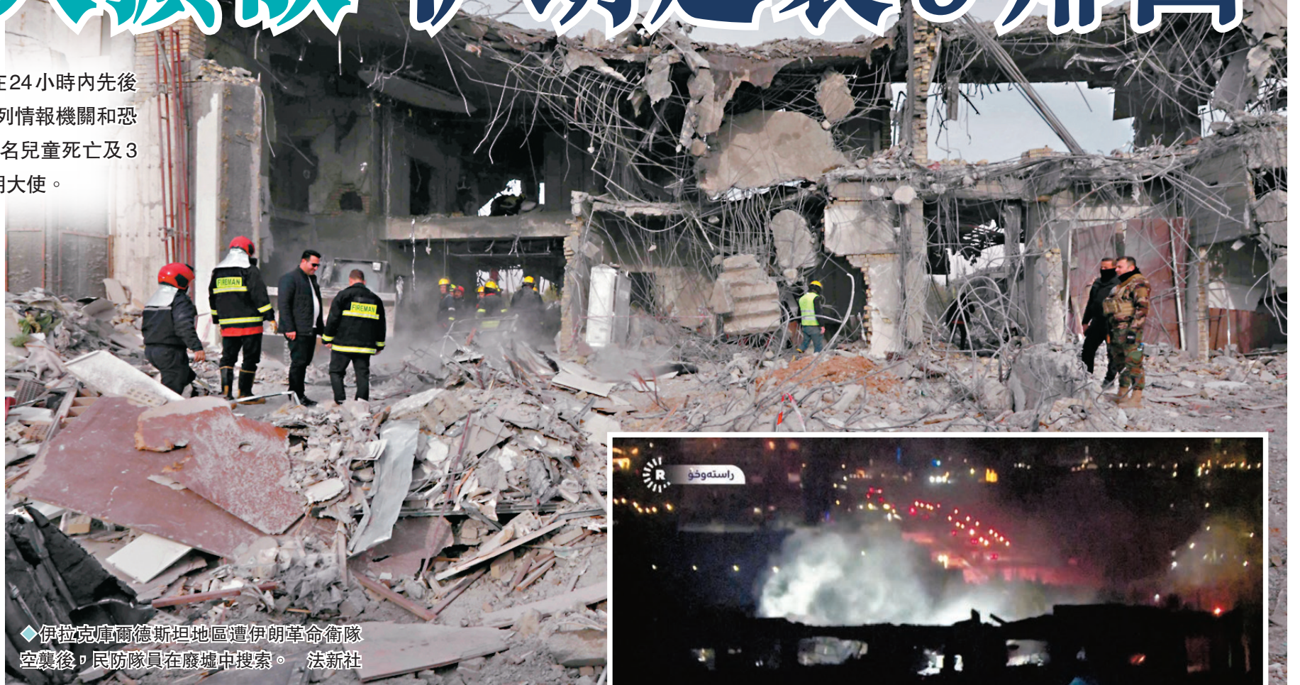
◆伊拉克庫爾德斯坦地區遭伊朗革命衛隊空襲後，民防隊員在廢墟中搜索。

伊朗周一晚曾發射導彈襲擊伊拉克庫爾德斯坦地區，聲稱打擊在當地的以色列情報機關基地，同日並空襲敘利亞，宣稱旨在摧毀極端組織「伊斯蘭國」目標。伊拉克指襲擊造成4死6傷，宣布召回駐伊大使；伊朗則去信聯合國，稱空襲是有針對性的反恐行動。阿卜杜拉希揚強調，伊朗尊重伊拉克領土完整，這次襲擊只是針對在伊拉克運作的以色列情報組織摩薩德。他又表示伊朗向巴基斯坦發射的導彈和無人機，只是針對與以色列有關的恐怖分子。