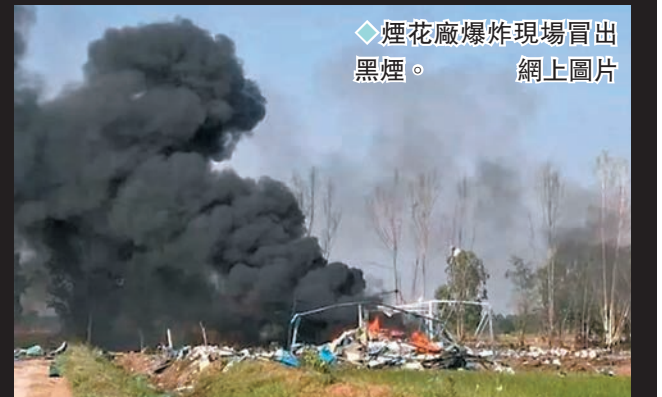
◆煙花廠爆炸現場冒出黑煙。網上圖片

泰國總理賽塔正在瑞士參加達沃斯世紀經濟論壇，總理府表示賽塔已知悉事件，指示官員加緊調查事故原因和涉事工廠經營狀況。賽塔向事故中的死者表示哀悼，以及向死者家屬表示慰問。