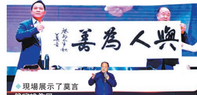
◆現場展示了莫言的書法作品。