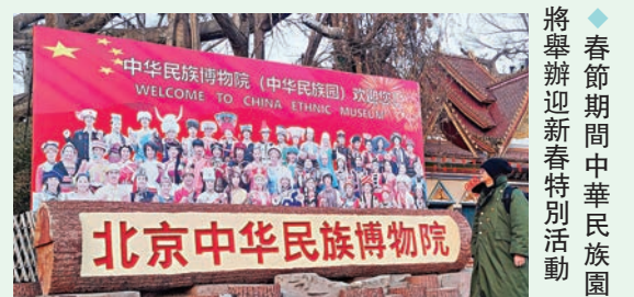
◆春節期間中華民族園將舉辦迎新春特別活動

在活動期間到中華民族園參觀，最有意思的是，可以學習到很多關於中國56個不同民族的知識和文化，也可以欣賞許多美麗的建築和自然景觀。如果想了解中國的文化和歷史，感受春節的