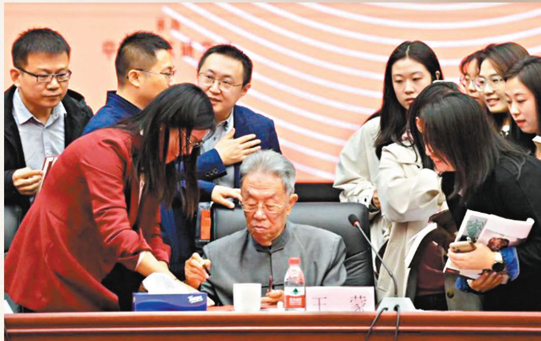
◆文學愛好者們在「王蒙文學創作70周年學術研討會」休息間隙與王蒙交流。