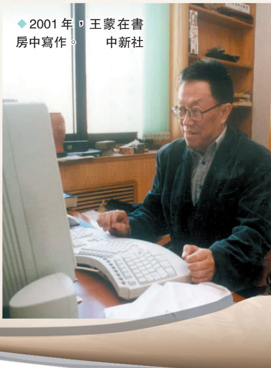
◆2001年，王蒙在書房中寫作。