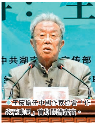
◆王蒙擔任中國作家協會「作家活動周」首期開講嘉賓。

剛剛過去的2023年，是作家王蒙文學創作70周年。生於1934年的他，2024年正是90歲。他以文字為人熟知，又身經仕途，於新疆生活了16年。可以說，作為與共和國共同成長的文學創作者，王蒙見證了中國當代文學的發展。