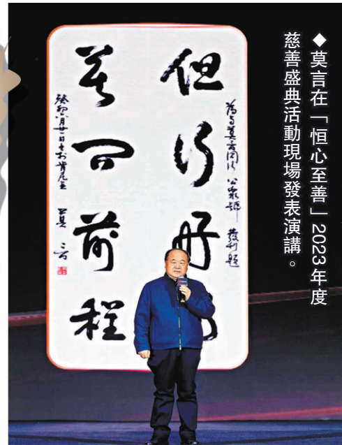
◆莫言在「恒心至善」2023年度慈善盛典活動現場發表演講。