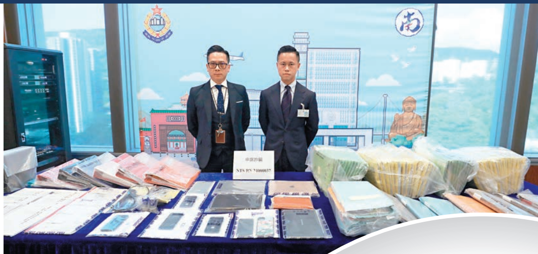
◆香港警方昨日向傳媒通報「正生會」涉嫌詐騙公眾捐款5,000萬元案情。圖為警方展示案件證物。

據了解，被捕的「正生會」4名男董事包括李永雄（77歲）、中學校長劉振華（50歲）、鄭天諾（34歲）和湯德崇（69歲），被通緝的3名董事包括正生書院校長陳兆焯（63歲），「正生會」創辦人、曾任正生書院校監的林希聖（69歲）及退休中學校長陳友志（62歲）。據了解，陳兆焯現身處英國，林希聖則在美國。