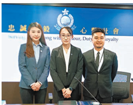
◆警方指案件涉及近190段兒童色情影片及738張兒童色情相片。香港文匯報記者鄭福強攝

香港文匯報訊（記者 蕭景源）2023年1月至11月，香港警方共錄得56宗兒童色情物品案件，其中近五成受害者年齡介乎12歲至16歲，有受害人更年僅9歲。為保護兒童，警方於本週二（16日）在全港多區展開一項代號「跨欄」的打擊與兒童色情物品行動，拘捕9名男子，檢獲逾900段兒童色情影片和相片及相關證物，其中3名被捕者包括兩名分別15歲及18歲的學生，有人更涉嫌偷拍或性侵犯未成年親妹。9人分涉「製作兒童色情物品」、「管有兒童色情物品」、「發布兒童色情物品」及「猥褻侵犯」罪被扣查。案件仍在調查，不排除更多人被捕。