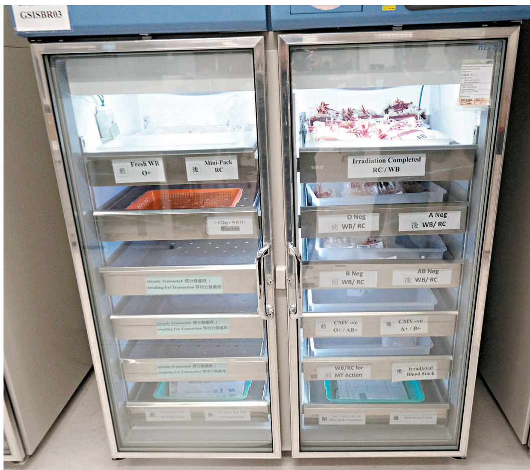
◆香港紅十字會輸血服務中心的血庫存量僅餘三四日用量。