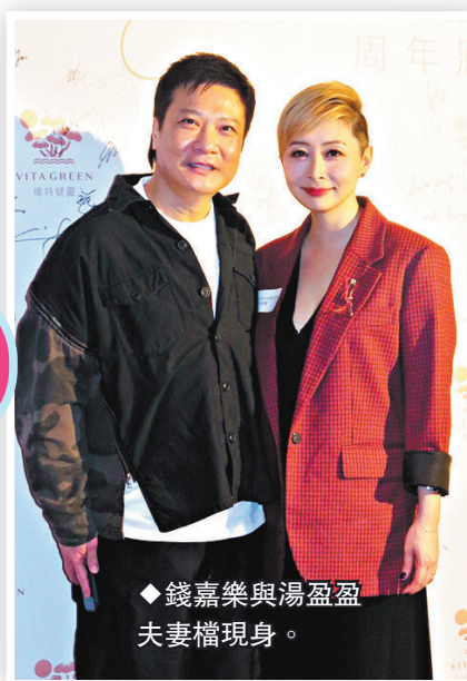
◆錢嘉樂與湯盈盈夫妻檔現身。