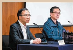
◀ 港專召開記者會交代事件。

陳卓禧表示，會提醒學生在現今網絡數碼化時代，個人言行變得相當透明，需考慮在這種生態下如何自處，以及留意對自己未來升