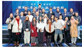
◆李樹建帶領團隊在上海豫園演出。

著名豫劇表演藝術家李樹建帶領團隊由今日起到1月23日於上海豫園進行駐場演出，開展「豫園·豫劇·豫劇·豫劇」活動。李樹建說：「豫劇是我國第一大地方劇種，上海是國際化大都市，以豫劇為代表的中原文化入駐上海豫園開展駐場演出，旨在堅定文化自信，延續歷史文脈，希望讓更多戲劇新秀通過這方舞台走向全國，走向世界。」