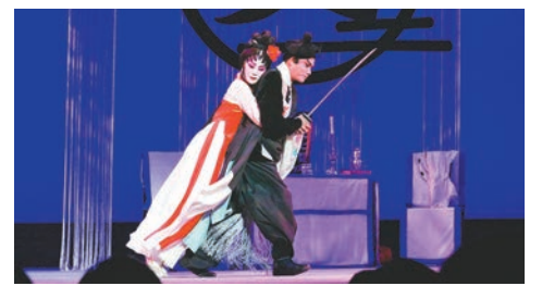
◆潘金蓮看了不可改變的事實，決心尋死。