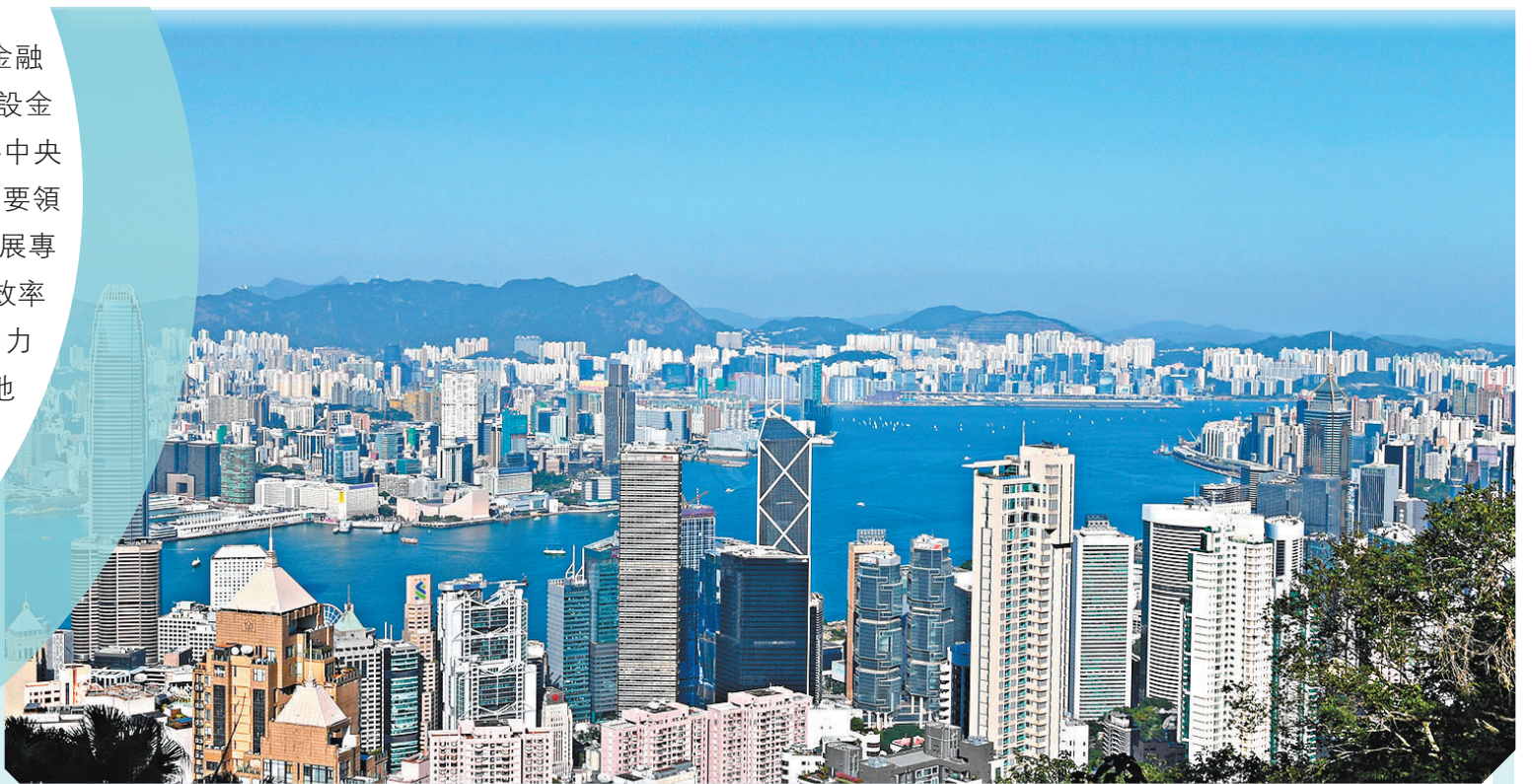
◆內地監管部門多次表態，支持和鞏固香港國際金融中心地位。 資料圖片

習近書記提到，要以制度型開放為重點推進金融高水平對外開放，落實准入前國民待遇加負面清單管理制度，對標國際高標準經貿協定中金融領域相關規則，精簡限制性措施。