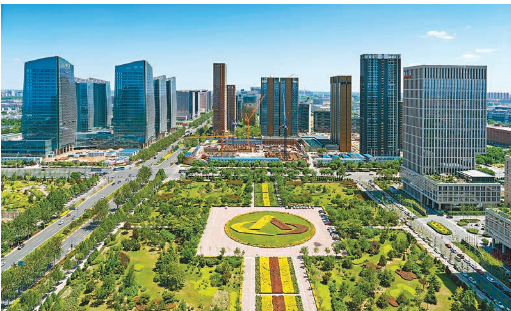
◆ 北京是全國首屈一指的科技創新中心。

簡介：資深文化工作者，從事新聞及教育工作多年，曾主理公民科和通識科相關網站及參與教科書出版。