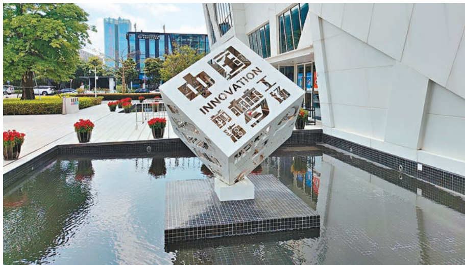
◆ 愈來愈多香港年輕人到大灣區內地城市就業創業。圖為深圳前海。