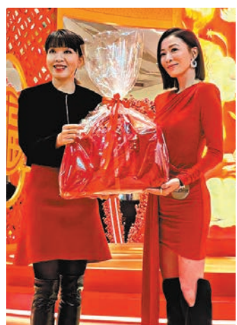
◆佘詩曼身穿全紅連身裙空降上海。

在詢問接下來的工作計劃時，佘詩曼表示忙完目前手上的工作，等過完年會先去巴黎時裝周，準備趁機放鬆一下。關於新年願望，佘詩曼則表示希望《新聞女王》的監製及編劇加油，非常期待《新聞女王2》的到來，期待一個更精彩的劇本。