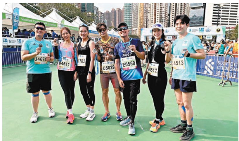
◆一班藝員亦有積極參與賽事。