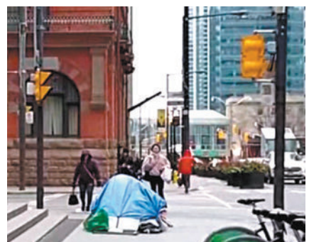
◆無家者在多倫多市中心街頭搭帳幕棲身。

奧布里表示，民眾獲得的社會援助追不上通脹侵蝕速度，直接把最低收入階層完全趕出住屋市場。無論在多倫多、溫哥華、渥太華抑或卡爾加利的市中心，無家可歸的露宿者到處可見。他力促聯邦政府加速調撥資源幫助流浪者找到棲身之所和治療毒癮，並指當局欠缺決心觸及問題的根源，尤其是沒有加快推行「住房優先」(housing first)計劃。奧布里估計「住房優先」計劃的建屋數量要增加兩倍，才能真正產生作用。