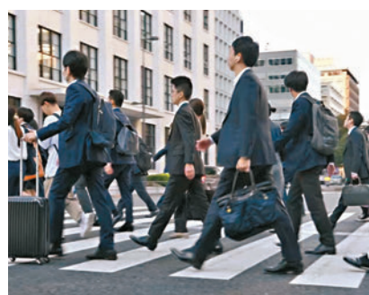
◆日圓兌美元匯率去年大幅貶值，導致日本經濟縮水。

7.8萬億港元)增加約30%，並非易事。 共同社分析，日圓兌美元匯率去年大幅貶值，導致日本經濟縮水。日本GDP排名下跌，意味日本的國際影響力可能隨之下滑。現時日本老齡化、少子化問題日趨嚴重，如何提升勞動生產效率成為提振經濟的考驗。 中國GDP在2010年超越日本，日本自此全球排第三，但遠遠被頭兩位的美國和中國拋離。