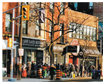
◆入不敷支的民眾排隊，輪候食物銀行派發物資。