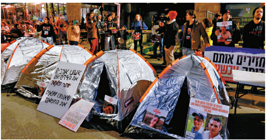
◆人質家屬在內塔尼亞胡私人住宅前搭起帳篷，以示抗議。

斯要求我們的軍隊撤出加沙，並釋放(哈馬斯精英部隊)『努赫巴』的所有殺人犯。如果我們同意這一點，我們的士兵將白白犧牲，無法再保證我們公民的安全，下一個10月7日將只是時間問題。」 在內塔尼亞胡表態後，多名人質家屬在內塔尼亞胡位於西耶路撒冷的私人住宅前搭起了帳篷，並一度闖入以色列國會，以示抗議。