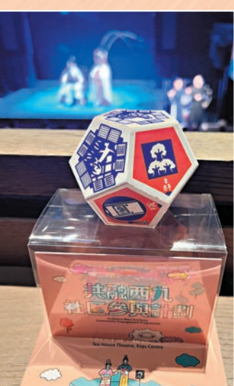
◆共融紀念品包括訂製舒壓球及一張附有點字的心意卡。