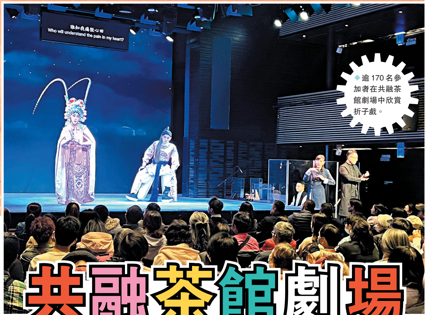
◆逾170名參加者在共融茶館劇場中欣賞折子戲。