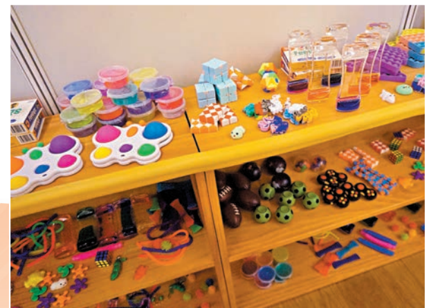
◆共融休息空間中備有多款舒壓小玩具。