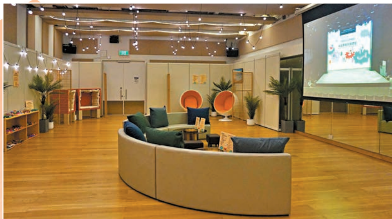
◆共融休息空間環境舒適，並會直播劇場節目。