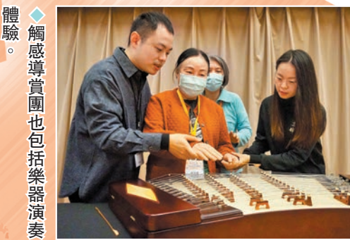
◆觸感導賞團也包括樂器演奏體驗。

共融茶館劇場體驗由茶館新星劇團傾力演出，節目包括折子戲及音樂演奏。劇場設有多種通達服務，包括口述影像、劇場視形傳譯、易讀場刊、輔助聆聽器材、輪椅使用者座位、電子服務鈴，並提供足夠空間予導盲犬。17日舉行的活動匯聚逾170名殘疾及非殘疾人士、少數族裔人士、長者、低收入人士等，劇場座無虛席，不時爆發掌聲和叫好聲。