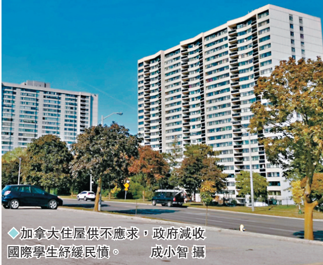
◆加拿大住屋供不應求，政府減收國際學生紓緩民憤。