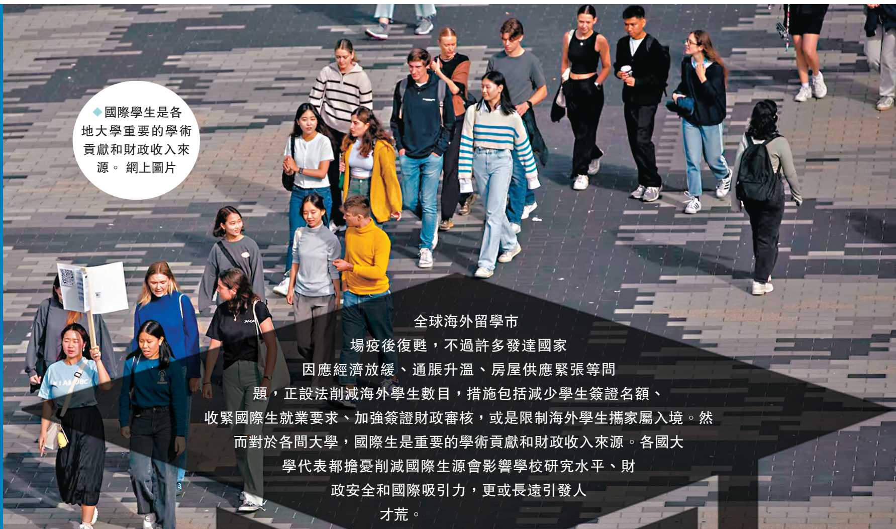
◆國際學生是各地大學重要的學術貢獻和財政收入來源。網上圖片