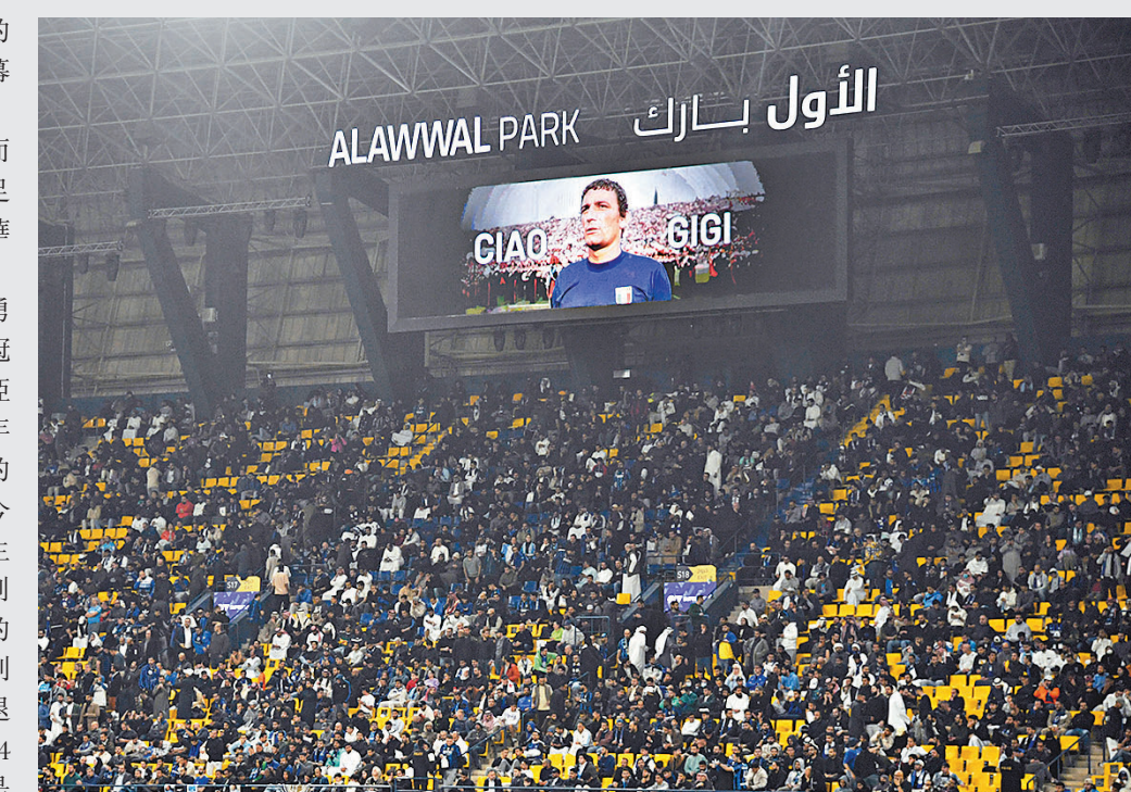
◆意超盃比賽為利華進行悼念儀式。

香港文匯報訊（記者 梁志達）保持着意大利國家足球隊歷史神射手紀錄的一代傳奇前鋒利華，於當地時間周一因病辭世，享年79歲。 據報利華是由於心臟病不治離世。意大利足球界對利華致以悼念，他曾効力的卡利亞里在社交平台發文致敬「永遠的利華」，並附上他們球隊英雄職業生涯巔峰時期的照片。意大利足總主席卡維拿表示：「意大利足球界都在哀悼，國家隊一座真正的古碑今天離開了我們。」意甲賽會表示，利華「將永遠因為他在卡利亞里和國家隊表現而被入銘記。」本港時間昨日