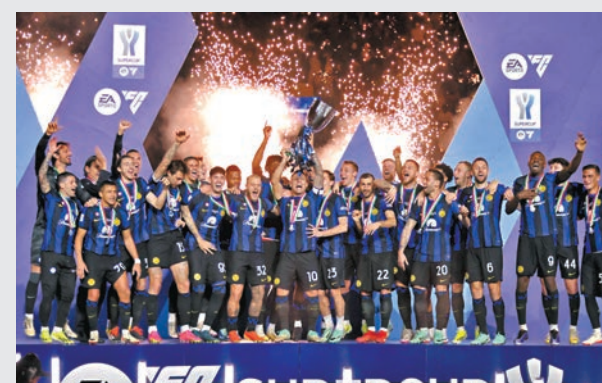
◆拿達路馬天尼斯(捧盃者)帶領國米捧起意超盃。路透社