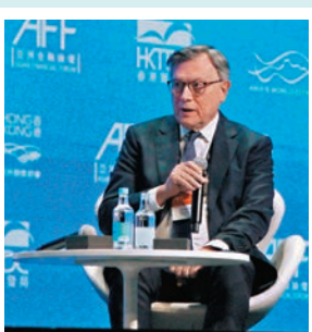
◆ 渣打集團主席韋浩思預測亞洲今年經濟增長約 5%。

香港文匯報訊（記者 蔡競文）金融機構對全球及香港的整體環境持續看好，渣打集團主席韋浩思昨日出席亞洲金融論壇時表示，對於今年全球環境比較樂觀，在一年前全球仍是通脹壓力高企，為壓制通脹，各國央行提高基準利率，而貨幣緊縮政策引發全球對衰退的擔憂。在目前看來，全球經濟正在相對緩慢地增長。從全球的經濟增長來看，發達國家於今年的預測經濟增長約為 2%，新興市場尤其是亞洲的預測經濟增長約 5%，亞洲經濟增長主要由三大驅動力支持，包括中國、印度和東盟地區。