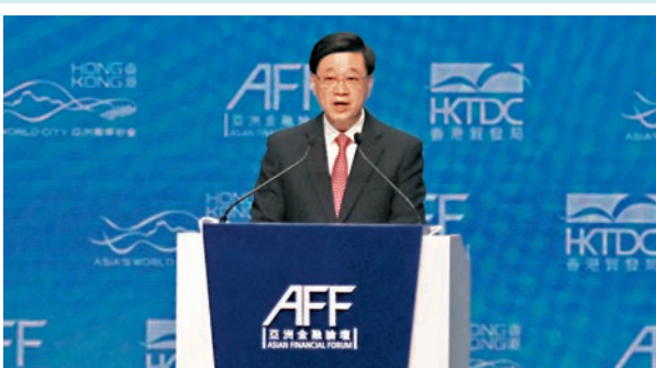
◆ 行政長官李家超指，國際合作在去全球化和脫鈎不斷升級的世界中顯得特別重要。

香港文匯報訊（記者 曾業俊）特區政府行政長官李家超昨日在亞洲金融論壇致開幕辭時表示，國際合作在去全球化和脫鈎不斷升級的世界中顯得特別重要，國際市場碎片化只會導致成本上升、市場流動性減少，最終導致金融體系萎縮和不穩定。香港在「一國兩制」的原則下，可以為亞洲以至世界各地的企業及經濟體創造機會，相信香港可為實現國際社會共同的光明未來作出貢獻。