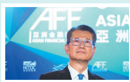
◆ 財政司司長陳茂波表示，香港致力建立符合最佳國際標準的綠色金融體系。

他表示，自新冠疫情以來全球面對「去風險化」與「友岸外包」的行動及言論，但這些言行會威脅各國過去