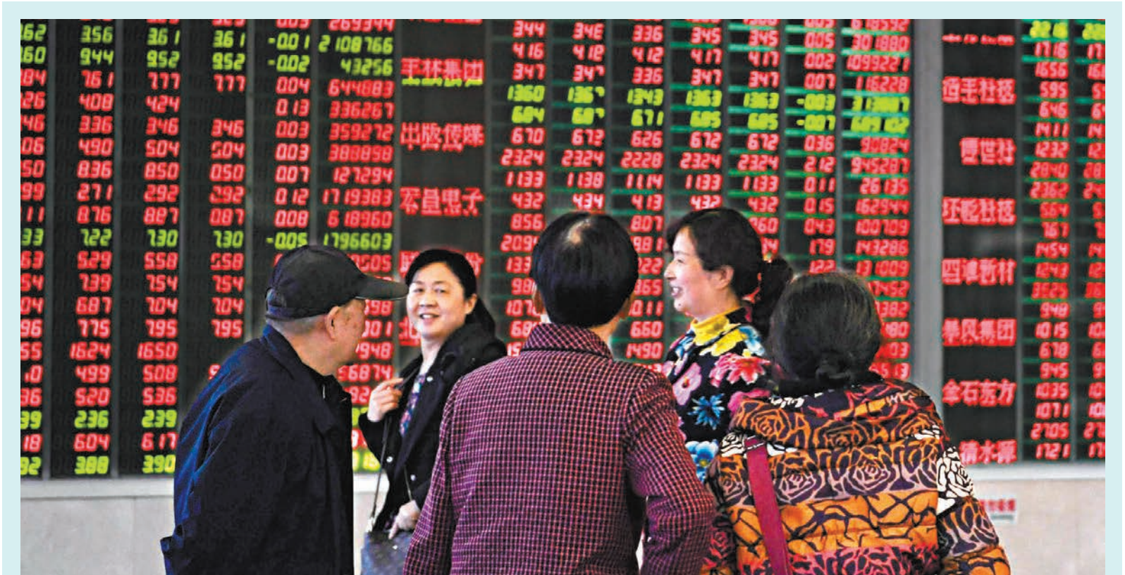
◆國務院國資委將着力提高央企控股上市公司質量，強化投資者回報。圖為內地一家證券營業廳內的股民關注大盤數據。

內地央企市值管理可以追溯到十年前。早在2014年初，在經歷多年熊市之後大量大型國有控股上市公司股價跌破每股淨資產，當時監管層就召集9家商業銀行和6家央企相關負責人召開了「上市公司回購普通股」專題座談會，主要內容是上市公司利用回購普通股進行市值管理的可行性和市場需求，並取得了積極效果。根據當時多家上市公司公告，在此時間段都曾與券商等開展市值管理戰略合作。不過與此同時，也出現以「市值管理」之名操縱股價、惡意坐莊的行為，中國證監會當年通報了18例涉嫌市場操縱案，對企圖以所謂「股價維護、市值管理」方式渾水摸魚的上市公司或其大股東、中介機構敲響了監管警鐘。