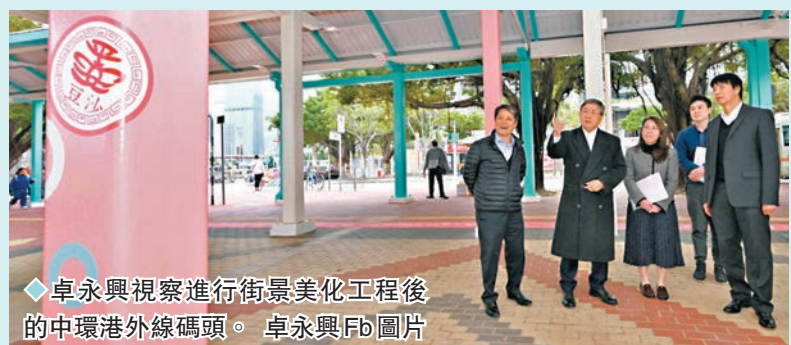
◆卓永興視察進行街景美化工程後的中環港外線碼頭。

香港文匯報訊 特區政府去年開展改善市容工作。其中，路政署在中環港外線碼頭、大圍港鐵站及荃灣路德園三個小區，進行街景美化工程。政務司副司長卓永興昨日在社交平台表示，路政署在中環港外線4號碼頭(往南丫島榕樹灣和索罟灣)、5號碼頭(往長洲)和6號碼頭(往大嶼山坪洲和梅窩)對出行人路的美化工程，經已竣工。本周初他約同路政署署長陳派明到現場，視察工程的效果。