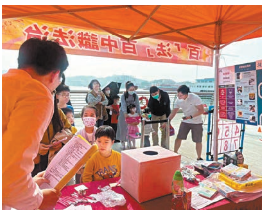
◆思法·青見在社區設置「百『法』百中識法治」遊戲攤位，以生動遊戲手法向中、小學生及其家長宣講法治。

他期望思法·青見能藉其青年法律人的熱誠及法律專業背景，在未來能有更多機會與香港社區各界領袖及團體合作，以不同形式的活動，共同做好香港社區的法治宣講，以及為香港的法治建設繼續積極作出貢獻。