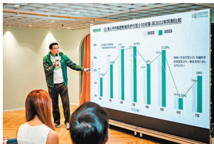
◆世界綠色組織公布港人步行習慣調查結果，顯示部分港人步行時間嚴重不足。

為鼓勵市民養成步行習慣，世界綠色組織與港鐵合作，於今年3月在中環海濱活動空間再舉行「地球·敢『動』行城市定向比賽」。比賽分競賽組和繽紛組，參賽隊伍須於限定時間內自行擬定路線，以最快速度徒步尋找位於中環至灣仔海濱各個檢查點，最快完成所有關卡的隊伍，就能夠競逐冠軍。