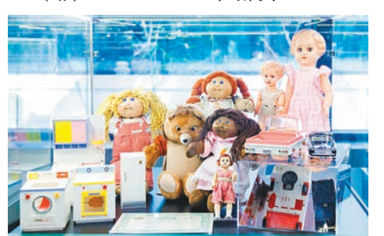
「港文化·港連結」——點止玩具咁簡單