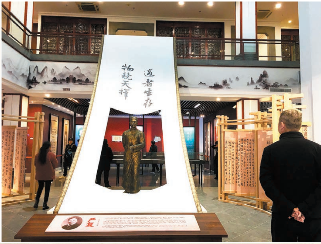
◆嚴復雕像及他的名言「物競天擇，適者生存」。

2024年1月8日，是嚴復誕辰170周年。嚴復是中國近代史上向西方尋找救國真理的第一代知識分子的代表，以非凡的見識引進新的世界觀和方法論，警醒沉睡的中國；他又是最早對西方近代文明表示失望，最新認識到中國文明價值的中國人之一。為紀念這位偉大的先賢，嚴復的故鄉——福建省福州市以一場學術研討會、四場涉及嚴復翰墨真跡、譯著、著作、生活物件，以及後世研究嚴復思想的出版物展覽等系列活動，緬懷這位傑出的啟蒙思想家、翻譯家和教育家。尤以「先生回家——嚴復近代中國名人特展」這場展覽，讓後人得以窺見嚴復一生「談笑有鴻儒，往來無白丁」的「朋友圈」，以及身處風雲激盪的大時代下多元立體的生命境界。 ◆文、攝：香港文匯報記者 何德花 福州報道