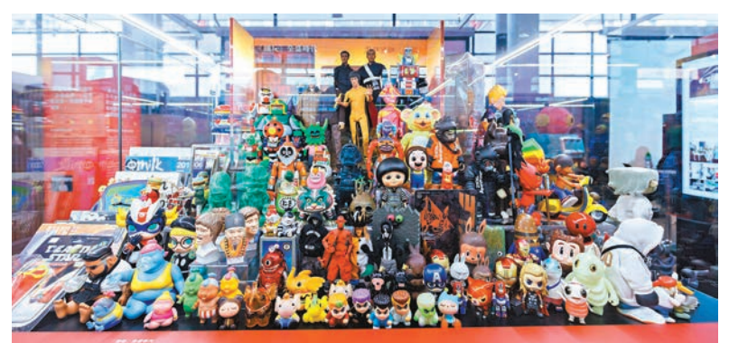
香港曾是全球最大的玩具出口產地，無論對世界玩具業，以至本地工業和經濟發展都帶來深遠的影響。今年文化葫蘆就以「玩具」作為主題，帶領公眾於以保育為己任的中環街市，重新了解這個曾經被稱為玩具王國的歷史。

策展人吳文正於官方網站撰文表示：「玩具世界包羅萬有，千變萬化，隨着時代的發展出現林林總總的玩具令人開心愉悅，玩不釋手。說到對玩具的感受和意義，會因應客觀環境和文化差異有所不同，更會因人而異。」