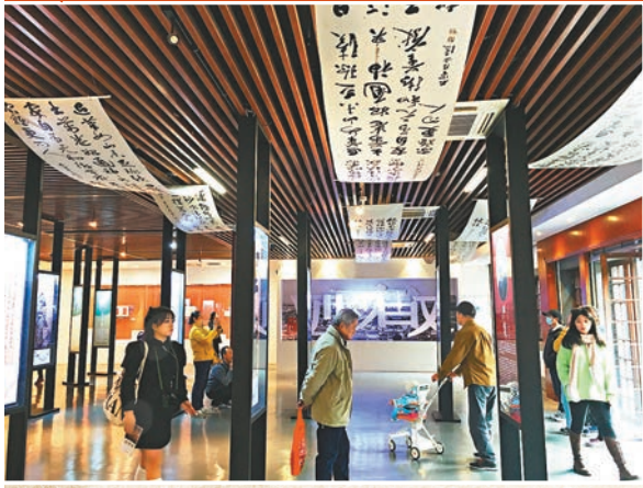
◆「先生回家——嚴復近代中國名人特展」現場。