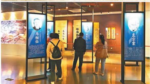
◆展覽揭示了嚴復與許多中國近代傑出人物之間千絲萬縷的關係。

「先生回家——嚴復與近代中國名人」特展日前在福州三坊七巷舉行。展廳不遠處，是嚴復晚年居住的郎官巷20號，1921年10月嚴復長辭於此。嚴復翰墨館館長鄭志宇是今次紀念嚴復四場展覽的策展人之一，幾乎所有的展品均出自他個人收藏。 「嚴復之所以成為嚴復，與特殊時代的風雲際會，尤其是特殊時代中的傑出人物有着千絲萬縷的關係。」早年因在香港一場拍賣會上「邂逅」嚴復一枝紙信札，從此迷上嚴復的鄭志宇，近些年的藏品從嚴復拓展至「嚴復朋友圈」，以嚴復為中心，內環主要有沈葆楨、林紓、陳寶琛、陳衍、薩鎮冰等書寫了半部中國近代史的閩籍同鄉；外環則是郭嵩燾、梁啟超、黃遵憲、張元濟、吳汝綸等引領一時風氣的近代文化名流。「從這些他們之間的私人信件、日記、或公文中，可以窺見他們之間的距離或遠或近，但始終相互作用，在無形的引力場中共同構成近代中國文化版圖裏群星閃耀的壯麗圖景。」鄭志宇說。