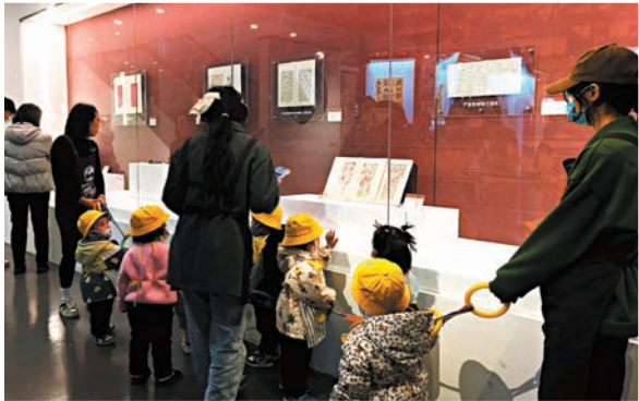
◆民眾參觀嚴復相關展品。