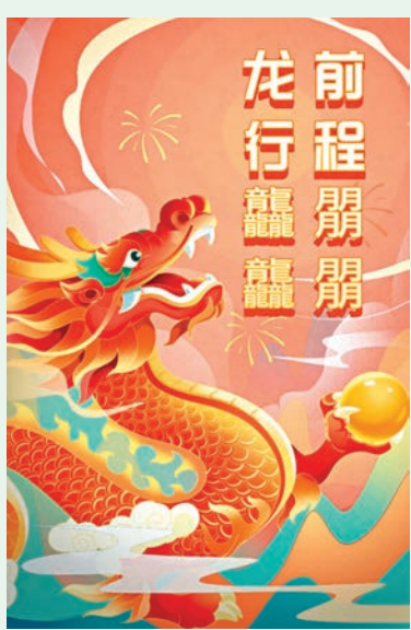
◆「龍行龔龔 前程翳翳」是2024年最流行祝福語。

第二年，2022年，疫情嚴峻隔離在家，元宇宙大熱，所以年初寫了幾篇科幻愛情短篇故事：我穿越元宇宙去愛妳，老虎年我在「無為」元宇宙過春節。疫情放開能出門就寫線下活動見聞：北京冬奧和香港疫情的冰火二重天；內地港人家長喜訊 民心學校解決小孩升學問題；京港文化科技