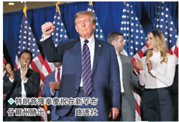
◆特朗普揮拳慶祝在新罕布爾州勝出。

新罕布爾州民主黨周二也舉行初選，總統拜登名字雖不在選票上，但仍以「自填參選人」身份取得逾50%選票，贏得這場初選。