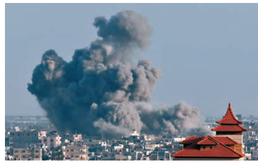
◆加沙或臨時停火一個月。法新社

哈馬斯發言人祖赫里周二(1月23日)表示，與以色列尚未達成協議，但對所有建議持開放態度，強調任何協議都必須以結束侵略和以軍從加沙完全撤軍為基礎。