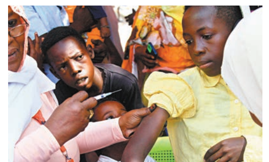
◆世衛呼籲各國應採取緊急措施，為更多人接種麻疹疫苗。