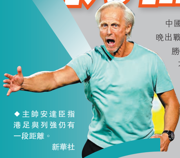
◆主帥安達臣指港足與列強仍有一段距離。