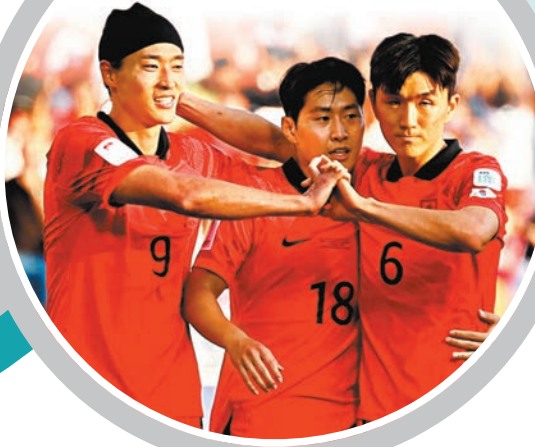
◆韓國隊有力晉級。

有1分排第3位的阿曼隊,今晚面對兩戰全敗,失4球沒有入球的吉爾吉斯隊,將要全力爭取大勝後上晉級。(HOY App今晚11:00p.m.直播)