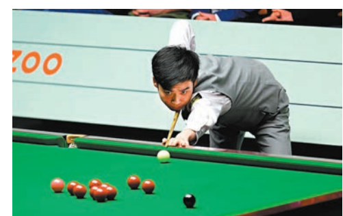
◆斯佳輝順利過關。