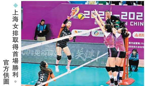
◆上海女排取得首場勝利。

賽後,雙方主教練都給予了對手高度評價。王之騰表示:「本場比賽兩隊都發揮出很高水平,最後打得非常激烈,幾個球決出了比賽的勝負。」天津渤海銀行女排主教練王寶泉稱:「今場比賽看下來,上海隊打得確實不錯,發球為我們製造了很大的困難。前兩局我們在進攻上沒有打出自己的東西,回去還需要總結。」