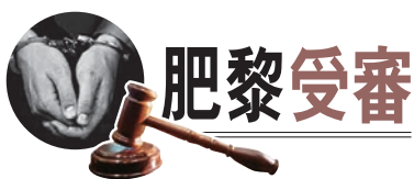
◆壹傳媒創辦人黎智英與《蘋果日報》3間相關公司被控串謀勾外力危害國安案，昨日踏入第十六日審訊。控方「從犯證人」、前壹傳媒行政總裁張劍虹繼續作供。連日來，控方就黎智英對《蘋果》英文版下達的編採指示盤問，昨日問及在《蘋果》英文版的文章內提及的「黃色經濟圈」。張劍虹供稱，黎智英支持「黃色經濟圈」，認為有助所謂的「抗爭」，並指示《蘋果》高層籌備「撐小店廣告」，讓「黃店」在《蘋果》免費登廣告。2020年初出現新冠疫情，該計劃一度暫停，至當年的年中恢復。 ◆香港文匯報記者 葛婷

控方昨日繼續就黎智英對《蘋果》英文版的編採指示提問。張劍虹確認英文版《蘋果日報》的內容包括專題、新聞、訪問和專欄共四個部分。專題是指大型專題，而專欄除了涵蓋中文版《蘋果日報》社論、黎智英撰文的《成敗樂一笑》，還會專找英文作者撰文。