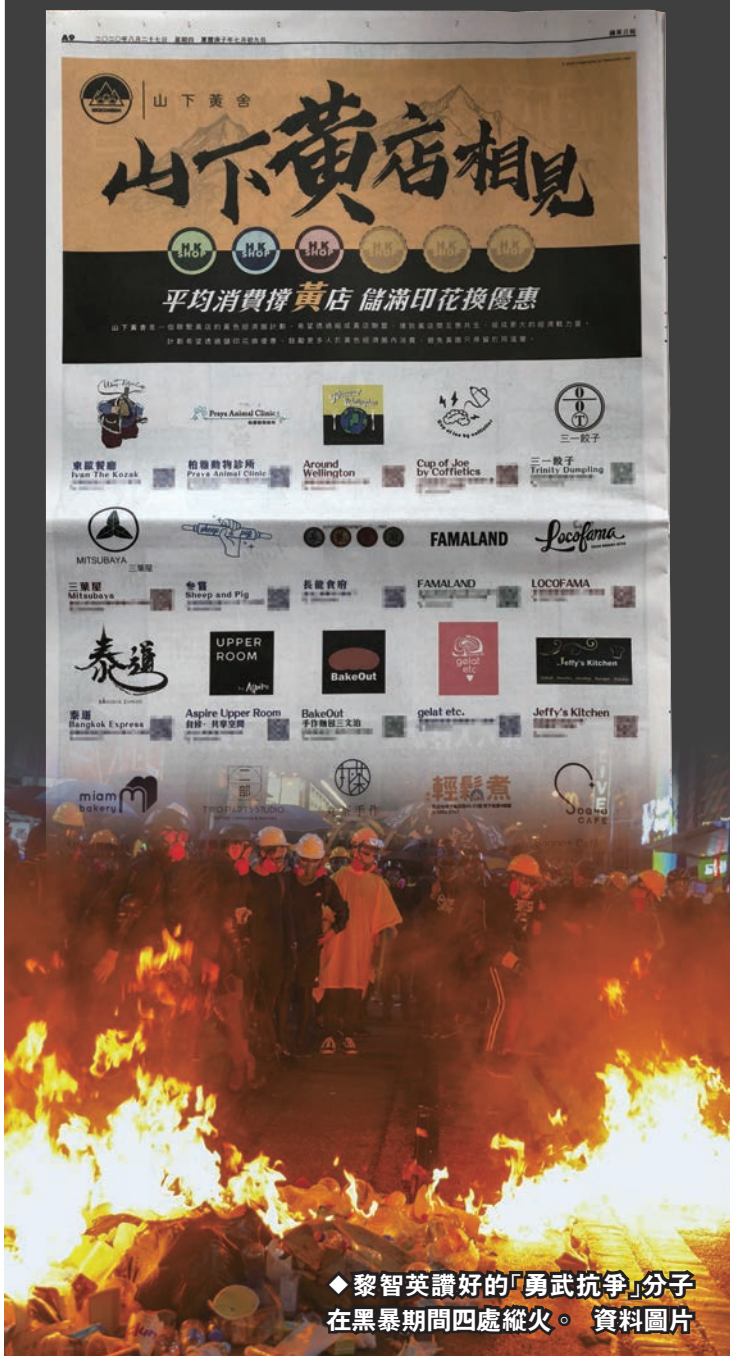
◆黎智英讚好的「勇武抗爭」分子在黑暴期間四處縱火。資料圖片