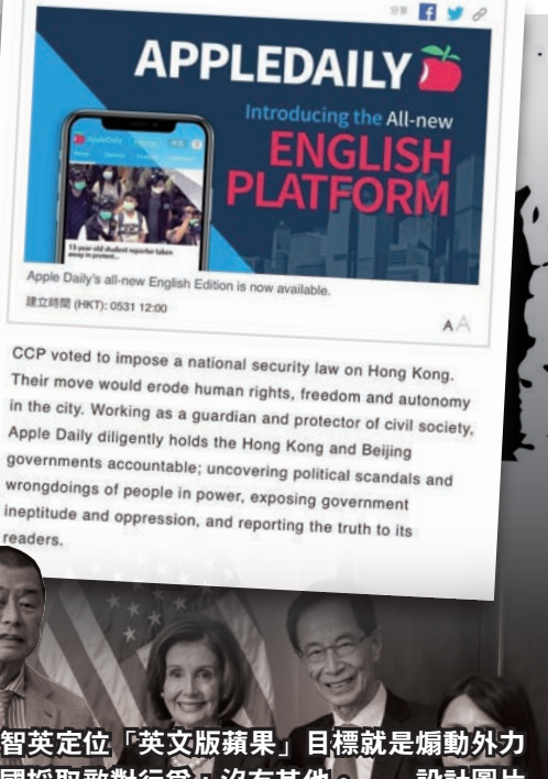
◆黎智英定位「英文版蘋果」目標就是煽動外力對中國採取敵對行為，沒有其他。設計圖片