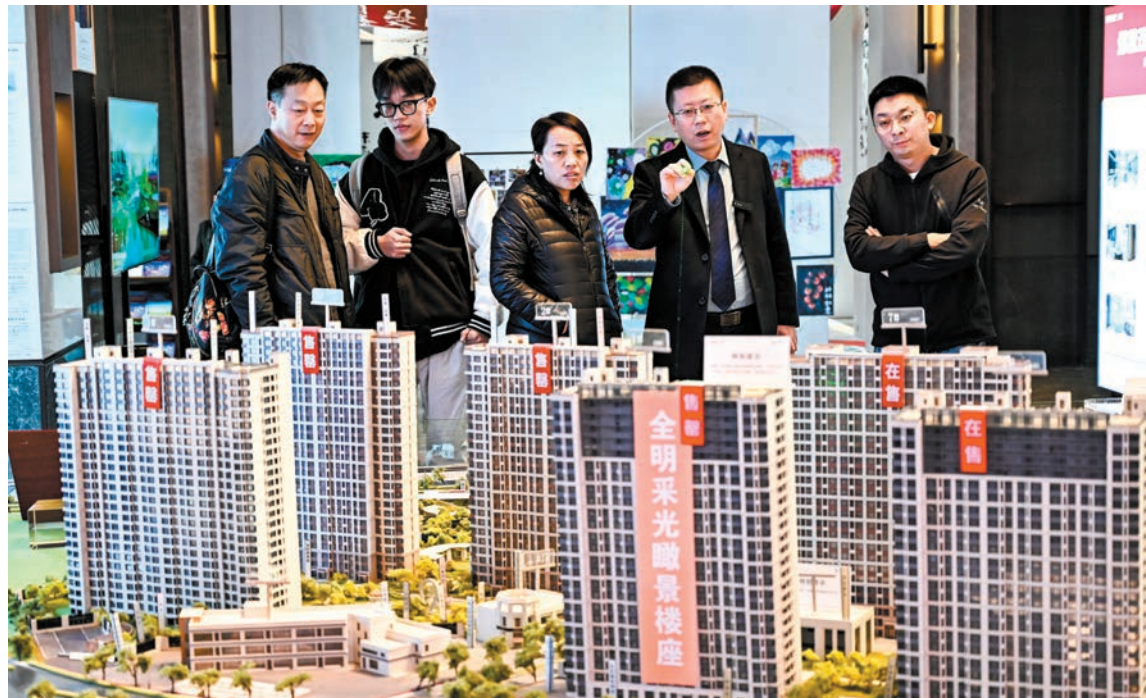
◆國家金融監督管理總局副局長肖遠企在發布會上表態金融業支持房地產「責無旁貸，必須大力支持」。圖為2023年11月4日，山西太原一家房地產售樓部內，購房者正在參觀。

另外，肖遠企透露，截至2023年底，3,500億元「保交樓」專項借款絕大部分都已經投放到項目，商業銀行還提供了相應的商業配套融資，確保「保交樓」任務完成。